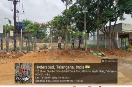
శనివారం ఉదయం యాక్సన్ ప్లాన్ తో కూల్చివేతలు, బోర్డుల ఏర్పాటు..

సైతం ట్యాంపర్ చేసి ప్లాట్లుగా మార్చేస్తున్న మూలా పుష్కలన్ని హైద్రా అధికారులు భగ్గుం చేశారు. 24 ఏళ్ళ క్రితం నాటి లేఅవుట్ లో అక్రమ పుష్కలం.. మేడ్చల్ మండల పరిధిలోని సర్వే నంబర్లు 873, 882 పరిధిలో ఈ వివాదం నెలకొంది. గత 2000 సంవత్సరంలో 13.31 ఎకరాల విస్తీర్ణంలో మొత్తం 256 ప్లాట్లతో సాయి శ్రీ నిలయం పేరిట ఒక సువిశాలమైన లేఅవుట్ వెలిసింది. నిబంధనల ప్రకారం ఈ లేఅవుట్ లోని ప్లాట్ నంబర్లు 111, 112, 113, 114, 115, 116లను కలిపి మొత్తం 1,970 చదరపు గజాల స్థలాన్ని కాలనీ పార్కు కోసం ప్రత్యేకంగా కేటాయించారు. 'హైద్రా ప్రజావాణి' తిరుగులేని అస్త్రం.. స్థానిక కట్టాపై కాలనీ నివాసితులు మిన్నకుండిపోలేదు. తాము దాచుకున్న డబ్బులతో కొనుక్కున్న ప్లాట్ల మధ్యలో పార్కు మాయమవడాన్ని సాయి శ్రీ నిలయ రెసిడెన్స్ వెల్ఫేర్ సొసైటీ ప్రతినిధులు తీవ్రంగా పరిగణించారు. నేరంగా 'హైద్రా ప్రజావాణి' వేదికగా అధికారులకు గట్టి ఆధారాలతో ఫిర్యాదు చేశారు. ఫిర్యాదు అందిన వెంటనే హైద్రా కమిషనర్ ఆదేశాల మేరకు యంత్రాంగం కదిలింది. రెవెన్యూ, మున్సిపల్, సర్వే శాఖల అధికారులతో కలిసి క్షేత్రస్థాయిలో ఉమ్మడి విచారణ జరిపింది. పాత సీట్ డీటెలు, ఒరిజినల్ లేఅవుట్ మ్యాప్ లను నిశితంగా పరిశీలించి, అక్కడ జరిగిన పక్కా కట్టాయేనని అధికారులు ప్రాథమికంగా తేల్చేశారు.