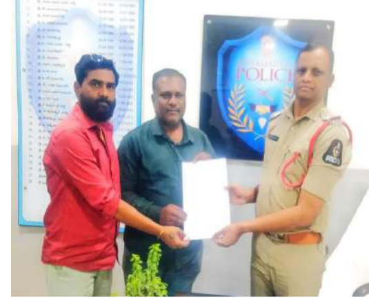
నిందితుడిపై కఠిన చట్టపరమైన చర్యలు తీసుకుని జర్నలిస్టులకు రక్షణ కల్పించాలని పోలీసులను కోరారు.