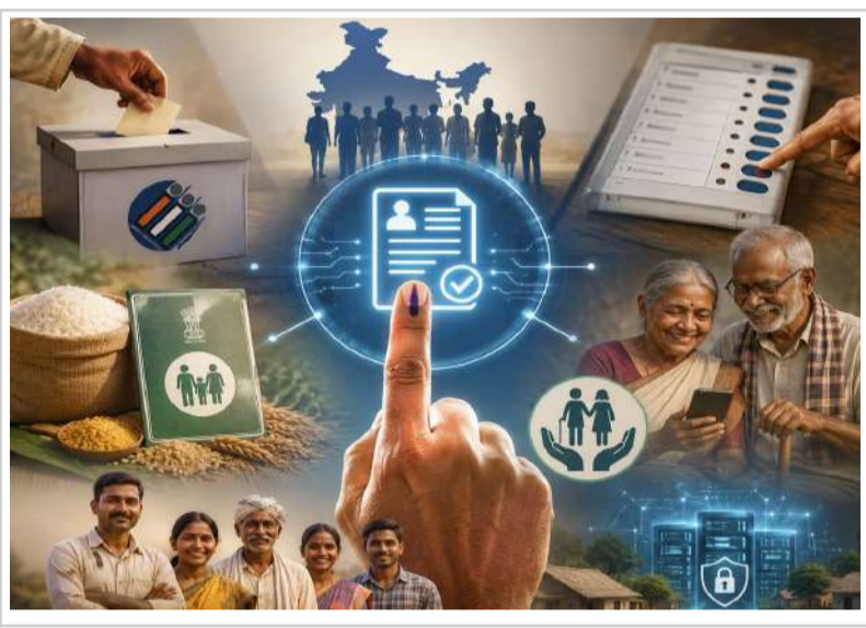
బెంగాల్లో జరిగిన ఈ ఉదంతం దేశవ్యాప్తంగా ఉన్న సామాన్య ఓటర్లకు ఒక పెద్ద కనువిప్పు లాంటిది.

ప్రభుత్వాలకు లబ్ధిదారుల వడపోత కోసం డేటాబేస్లను ఎలా వాడుతున్నాయో చెప్పడానికి పశ్చిమ బెంగాల్ ప్రభుత్వం చేపట్టిన తాజా చర్యలే ఒక నిదర్శనం. అక్కడ ఆర్డర్లను తీసి, బోగస్, నకిలీ రేషన్ కార్డుదారులను ఏవేసేందుకు ఆ రాష్ట్ర యంత్రాంగం ఎన్ఐఆర్ ఓటర్ డేటాబేస్లను ప్రామాణికంగా తీసుకుంటోంది. రేషన్ కార్డులో పేర్లు ఉండి, ఓటర్ జాబితాలో లేని వారిని, లేదా అసలు ఓటు హక్కు లేని వారిని డిజిటల్ వడపోత ద్వారా గుర్తించి లక్షలాది బోగస్ కార్డులను రద్దు చేస్తున్నారు.