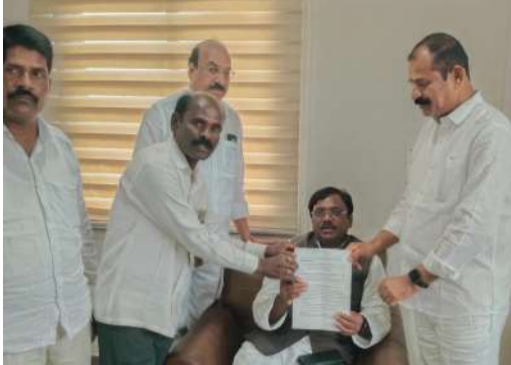
తెలిపారు. జిల్లా కలెక్టర్ కె. హైమావతితో స్వయంగా మాట్లాడి నిర్వాసితుల పెండింగ్ సమస్యలను పరిశీలించి పరిష్కారానికి చర్యలు తీసుకునేలా చూస్తామని, వినతిపత్రంలోని ప్రతి అంశాన్ని ప్రభుత్వ దృష్టికి తీసుకెళ్లి సార్వమైనంత త్వరగా పరిష్కారం దిశగా కృషి చేస్తామని మంత్రి నిర్వాసితులకు హామీ ఇచ్చారు. ఈ కార్యక్రమంలో మల్లన్నసాగర్ నిర్వాసితులు, ప్రజాప్రతినిధులు, గ్రామాల పెద్దలు, బాధిత కుటుంబాలు పెద్ద సంఖ్యలో పాల్గొన్నారు.

మంది, వేములపాటి కు చెందిన 39 మంది ఒంటరి మహిళలు హైకోర్టును ఆశ్రయించగా నాలుగు నెలల్లో ప్యాకేజీలు మంజూరు చేయాలని ఆదేశాలు వచ్చినప్పటికీ అమలు కాలేదని తెలిపారు. అలాగే 2019 ఫిబ్రవరి 6 కట్ ఆఫ్ థేటి వరకు జీవించి అనంతరం మరణించిన అర్హుల కుటుంబాలకు కూడా ఆర్ అండ్ ఆర్ ప్యాకేజీలు వర్తించజేయాలని కోరారు. పెండింగ్లో ఉన్న షాట్ల రిజిస్ట్రేషన్లు పూర్తి చేయాలని, తాగునీరు, డ్రైనేజీ, సీని రోడ్లు, వీధి దీపాలు, శుశాసనాధిక వంటి మౌలిక సదుపాయాలు కల్పించాలని, నిర్వాసితుల యువతకు ఉపాధి అవకాశాలు కల్పించాలని విజ్ఞప్తి చేశారు. గతంలో ఇచ్చిన హామీ మేరకు పడేళ్లపాటు ఇంటి పన్ను మినహాయింపు, భవన నిర్మాణ అనుమతులు ఉచితంగా ఇవ్వాలని, ముఖ్యమంత్రి ప్రకటించిన పునరావాస ప్యాకేజీలను వెంటనే అమలు చేయాలని డిమాండ్ చేశారు. వినతిపత్రాన్ని స్వీకరించిన మంత్రి వివేక్ వెంకటస్వామి అత్యంత సానుభూతితో పరిశీలిస్తానన్నారు. ఇంటి పన్ను మినహాయింపు, భవన అనుమతులు రుసుము మాఫీ, పెండింగ్ ఆర్ అండ్ ఆర్ ప్యాకేజీలు, ఒంటరి మహిళలకు ప్రత్యేక ప్యాకేజీలు, షాట్ల రిజిస్ట్రేషన్లు, మౌలిక వసతుల కల్పన తదితర అంశాలపై సంబంధిత అధికారులతో సమీక్ష నిర్వహిస్తామని