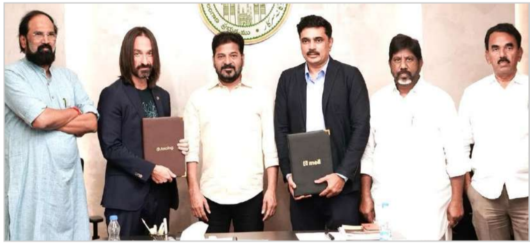
ముఖ్యమంత్రి రేవంత్ రెడ్డి ప్రతిపాదిత హైదరాబాద్ ట్రాఫిక్ పైల్ట్ ప్రాజెక్ట్ బిల్డింగ్ పనులు వివరించారు. అధునాతన సాంకేతిక పరిజ్ఞానాన్ని ఉపయోగించి నగరంలో రవాణా సౌకర్యాలను మెరుగుపరచడం, సిటీ మేనేజ్మెంట్ను సులభతరం చేయడంపై ఈ ప్రాజెక్ట్ దృష్టి సారించనుంది. సెన్సార్లు, రోబోటిక్స్, ఆర్టిఫిషియల్ ఇంటెలిజెన్స్ కలయికతో

విజయ్ సర్కారుపై కుట్ర విజయ్ సర్కారుపై కుట్ర విజయ్ సర్కారుపై కుట్ర