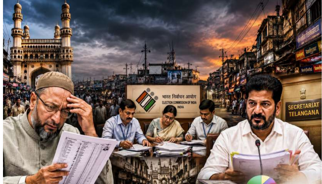
ఒకే ప్రాంతంలో స్థిర నివాసం లేని వారికి, సరైన అవగాహన లేని పేదలకు ఈ పత్రాలను సమర్పించడం ఒక పెద్ద సవాలుగా మారింది. దీంతో త్రేతస్థాయి పరిశీలనకు వచ్చే అధికారులు నిబంధనల సాకుతో వేలాది మంది ఓట్లను తొలగిస్తున్నారని, ఇది కేవలం ఒక ముస్లింపల్ వార్డుకో లేదా నియోజకవర్గానికో పరిమితం కాకుండా మొత్తం పాతబస్తీ పాలిటికల్ డెమోగ్రఫీని మార్చేసినంత 2లో..

డాక్యుమెంట్లు కప్పమే పాతబస్తీలోని సామాజిక, ఆర్థిక పరిస్థితులను గమనిస్తే.. ఇక్కడి జనాభాలో అత్యధికులు అద్దె ఇళ్లలో, మురికివాడల్లో నివసించే పేద వర్గాలే. మారుతున్న నిబంధనల ప్రకారం ఓటు సమయం లేదా సవరణకు సరైన అడ్డం ప్రూఫ్, ఆధార్ లింకేజీ, గ్యాస్ లేదా ఎలక్ట్రికల్ బిల్లులు వంటి పక్కా పత్రాలను అధికారులు డిమాండ్ చేస్తున్నారు. అయితే, చాలా కాలంగా