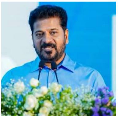
ఓఆర్ఆర్ బయటకు పరిశ్రమలు ప్రిమియర్ ఎన్టీసీ రూపొందించిన మొట్టమొదటి సోలార్ ఆక్సీ డ్రీ - సోలార్ పవర్ ప్లాంట్ లైట్, 2లో..

తెలంగాణను దేశంలో అగ్రస్థానంలో నిలబెడతామన్న సీఎం రేవంత్ హైదరాబాద్ (ప్రశ్న స్కూప్) హైదరాబాద్ జైలర్ రింగ్ రోడ్డు అంతర్వేగం మొత్తంగా కాలుష్య రహిత ప్రాంతంగా తీర్చిదిద్దడానికి ప్రభుత్వం లక్ష్యాలను నిర్దేశించుకుని పనిచేస్తోందని ముఖ్యమంత్రి రేవంత్ రెడ్డి చెప్పారు. 2,100 చ.కి.మీ మేరకు విస్తరించి ఉన్న ఓఆర్ఆర్ లోపల కోర్ అర్బన్ ఏరియాలో 1 కోటి 35 లక్షల జనాభా అవసరాలకు అనుగుణంగా సగర్వాన్ని అభివృద్ధి చేస్తామన్నారు. సోలార్ మాడ్యూల్స్ తయారీ రంగంలో ప్రసిద్ధ ప్రిమియర్ ఎన్టీసీ సర్వ రంగారెడ్డి జిల్లా సీతారాంపూర్లో నెలకొల్పిన 5.6 గిగావాట్ల సామర్థ్యం కలిగిన సోలార్ మాడ్యూల్ తయారీ యూనిట్ను మంత్రి దుద్దిళ్ల శ్రీధర్ బాబుతో కలిసి ముఖ్యమంత్రి రేవంత్ రెడ్డి ప్రారంభించారు.