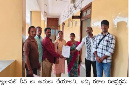
క్యాజువల్ లీట్ లు అమలు చేయాలని, అన్ని రకాల రిజిస్ట్రర్లను అందుబాటులో ఉంచాలని లెఖ రాశారు. గురువారం నాడు రిజిస్ట్రార్ కి, వైస్ ఛాన్స్ లర్ కి యూనియన్ ఆధ్వర్యంలో జాయింట్ లేబర్ కమిషన్ ఇచ్చిన ఆర్డర్ ను అమలు చేయాలని కుక్కీ కి రూ.19,502, అసిస్టెంట్ బుక్ కి రూ.17,757, హాస్ కీపింగ్, స్వాంతోజర్ ఇతర సెక్యూర్ ఉద్యోగులకు రూ.15,793 రూపాయలు అమలు చేయాలని డిమాండ్ చేస్తూ లెఖ ఇచ్చారు. ముఖ్యమంత్రి ప్రకటించిన ప్రకారంగా నేటి వరకు కాంట్రాక్ట్ లెక్కరద్దు, హాస్ట్

ఓ.యూ (ప్రశ్న స్వాస్) ఉస్మానియా యూనివర్సిటీ హాస్టల్ లో పనిచేస్తున్న ఉద్యోగులకు 2022 నుంచి వీడివే అమలు చేయడం లేదు. కనీస వేతనాలను అమలు చేయడం యూనివర్సిటీ బాధ్యత. కానీ ఇంతవరకు అమలు చేయకుండా హాస్టల్ ఉద్యోగులకు యూనివర్సిటీ అధికారులు తీవ్ర అన్యాయం చేస్తున్నారు. టియూసిఐ అనుబంధ ప్రోగ్రెస్ కంట్రాక్ట్ అండ్ క్యాజువల్ వర్కర్ల యూనియన్ అనేక దఫాలుగా వైస్ ఛాన్స్ లర్, రిజిస్ట్రార్, డిప్ ఛాన్స్ లర్ కు వివేచిత్రం ఇచ్చింది. ఫలితము రాలేదు. ఈ విషయంపై యూనియన్ ఆధ్వర్యంలో జాయింట్ లేబర్ కమిషన్ జంట నగరాలకు ఫిర్యాదు చేశారు. ఫిర్యాదుని అందుకొని జాయింట్ లేబర్ కమిషన్ ఎనిమిది రిలయ్ పాల్వూర్లు కార్మికుల యూనివర్సిటీ, యూనియన్ కి మధ్య జరిగాయి. ఐదు రోజుల కిందట యూనివర్సిటీ రిజిస్ట్రార్ కి, కాంట్రాక్ట్ లేబర్ చట్టం ప్రకారం, యూనివర్సిటీ చేసుకున్న ఒప్పందం ప్రకారం, కనీస వేతనాలను అమలు చేయాలని, ఏరియర్ల పాల్వూర్లు, కార్మికుల ప్రయోజనం చట్టబద్ధ హక్కులన్నీ కల్పించాలని, ఓవర్ టైం వేతనాన్ని పని గంటలు ఎక్కువ చేసిన ఉద్యోగులకి ఇవ్వాలని, వీకీ ఆఫ్ అమలు చేయాలని, నేషనల్ ఫెస్టివల్ హోదాలో తో పాటు, 20 రోజులకు ఒక