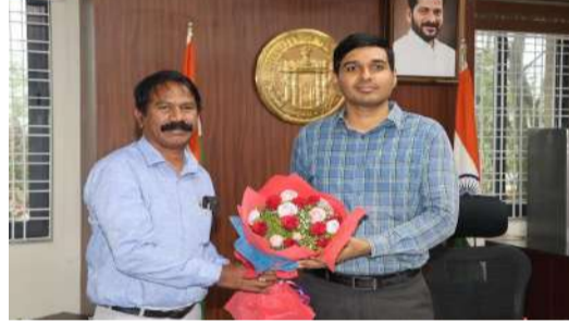
అధికారిగా విజయవంతంగా విధులు నిర్వహించారు. జిల్లాలోని ఆరోగ్య వ్యవస్థ, ప్రజారోగ్య కార్యక్రమాల మరియు మాతా-శిశు సంక్షేమ సేవల అమలుపై ఆయనకు విస్తృత అవగాహన అనుభవం ఉంది.