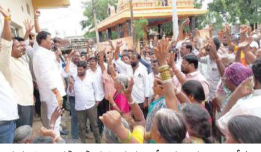
ఉద్యమాన్ని కొనసాగిస్తున్న స్పష్టం చేశారు. ప్రజల ఆరోగ్యం, విల్లుల భవిష్యత్తు కోసం బీఆర్ఎస్ పార్టీ పోరాటం చేస్తుందని అన్నారు. ఈ అంశంపై ఇప్పటికే జిల్లా కలెక్టర్ కలిసి వివేచిత్రం సమర్పించామని, ప్రజాభిప్రాయ సేకరణ నిర్వహిస్తున్నారని కలెక్టర్ హామీ ఇచ్చారని తెలిపారు. కంపెనీని వెంటనే తొలగించాలని డిమాండ్ చేస్తూ అధికారం ప్రజలతో కలిసి నిరాశోర దీక్ష చేపడతామని ప్రకటించారు. ఈ కార్యక్రమంలో బీఆర్ఎస్ పార్టీ నాయకులు, గ్రామస్థులు

కలుషితమై తాగునీటికి, వ్యవసాయానికి అనువుగా లేకుండా పోయాయని పేర్కొన్నారు. రాతింబవళ్లు కంపెనీ కార్యకలాపాలు కొనసాగడంతో భారీ శబ్ద కాలుష్యం ఏర్పడి విద్యార్థులు చదువుకోలేని, ప్రజలు ప్రశాంతంగా నిద్రపోలేని పరిస్థితి నెలకొందని విమర్శించారు. కంపెనీలో మరణాలు జరిగినా వాటిని గుర్తుపట్టదు కాకుండా ఉంచుతున్నారని, సంబంధిత శాఖలతో కమ్యూన్ వ్యవహరిస్తున్నారని ఆరోపించారు. స్థానికులకు ఉపాధి కల్పించకుండా ఇతర రాష్ట్రాలకు చెందిన వారిని నియమిస్తున్నారని, కంపెనీకి వ్యతిరేకంగా పోరాడుతున్న రెండు గ్రామాల ప్రజలపై అక్రమ కేసులు నమోదు చేసి భయభ్రాంతులకు గురిచేస్తున్నారని ఆరోపించారు. మెదక్ జిల్లా జాయింట్ కలెక్టర్ సమక్షంలో తప్పుడు ప్రజాభిప్రాయ సేకరణ నిర్వహించారని, దీనిపై సమగ్ర విచారణ జరిపి కంపెనీ అనుమతులను రద్దు చేసి యాజమాన్యంపై చర్యలు తీసుకోవాలని డిమాండ్ చేశారు. ఇకపై ఎలాంటి బెదిరింపులకు భయపడబోమని, రంగయ్యపల్లి, చెల్లె గౌరం గ్రామాల ప్రజలు తరఫున ఎంఎస్ అగర్వాల ఫౌండ్రీస్ కంపెనీ తొలగించే వరకు