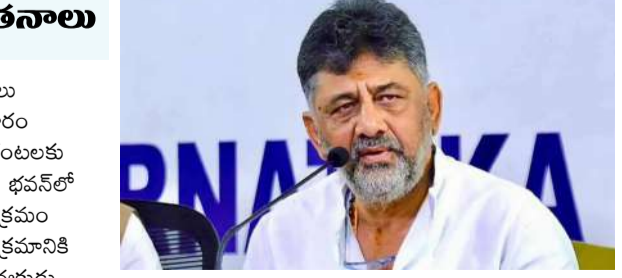
ఉంటుందని ఆ వర్గాలు పేర్కొన్నాయి. బుధవారం మధ్యాహ్నం 4.05 గంటలకు బెంగళూరులోని లోక్ భవన్ లో ప్రమాణస్వీకార కార్యక్రమం ఉంటుంది. ఈ కార్యక్రమానికి కాంగ్రెస్ జాతీయ అధ్యక్షుడు మల్లికార్జున ఖన్నే, ఆగ్రనేత రామోల్ గాంధీ సహా పలువురు హాజరుకానున్నారు. అయితే, డి.కే శివకుమార్ క్యాబినెట్ లో తొలి దశలో 10 నుంచి 20 మంది మంత్రులను చేర్చుకోవాలని ప్రణాళికలు ఉన్నాయి. ప్రాథమిక జాబితా

- క్యాబినెట్ కూర్పుపై అభివృద్ధి అభివృద్ధి అభివృద్ధి బెంగళూరు (ప్రశ్న న్యూస్) కర్ణాటక నూతన ముఖ్యమంత్రిగా డి.కే శివకుమార్ రేపు ప్రమాణస్వీకారం చేయనున్నారు. ఆయనతో పాటు మరో 10 మంది మంత్రులు ప్రమాణం చేస్తారని పార్టీ వర్గాల పేర్కొన్నాయి. ఢిల్లీలో కాంగ్రెస్ హైకమాండ్ తో ఆపద్ధర్మ ముఖ్యమంత్రి సిద్ధరామయ్య, డి.కే శివకుమార్ మంగళవారం చర్చలు జరిపిన అనంతరం తొలి విడత క్యాబినెట్ లోకి ఎవరిని తీసుకోవాలనే నిర్ణయానికి వచ్చినట్లు చెబుతున్నారు. మరో వారం పది రోజుల వ్యవధిలోనే క్యాబినెట్ విస్తరణ కూడా