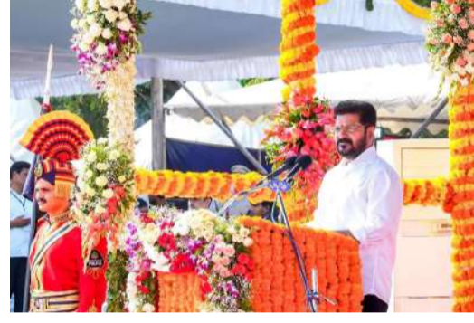
తెలియజేశారు. అన్ని రంగాల్లో ప్రగతిని సాధిస్తూ తెలంగాణ సమృద్ధిత, సమగ్రాభివృద్ధికి ప్రజాప్రభుత్వం తీసుకున్న సంకల్పం, నిర్దేశించుకున్న లక్ష్యాల సాధనలో ప్రజల ఆందందలు,

హైదరాబాద్ (ప్రశ్న న్యూస్) ప్రపంచానికి తెలంగాణను గేట్వేగా నిలబెట్టాలన్నది తన స్వప్నం అని సీఎం రేవంత్ రెడ్డి తెలిపారు. స్వరాష్ట్ర అభివృద్ధి కోసం దశాబ్దాల ఉద్యమం పోరాటాలు, ఎందరో అమరుల త్యాగాల చరిత్రను స్మరిస్తూ తెలంగాణను అభివృద్ధి చేసుకుని ప్రపంచానికి గేట్వేగా నిలబెట్టాలన్న స్వప్నం కోసం పునరంకితమవుదామని రాష్ట్ర ప్రజలకు పిలుపునిచ్చారు. తెలంగాణ ఆవిర్భావ దినోత్సవం సందర్భంగా సికింద్రాబాద్ పరేడ్ గ్రౌండ్స్లో నిర్వహించిన వేడుకల్లో సీఎం రేవంత్ రెడ్డి పాల్గొన్నారు. ఈ సందర్భంగా భద్రతా దళాల కమాండ్, పోలీసుల గౌరవ వందనం స్వీకరించారు. అనంతరం రాష్ట్ర ప్రజలను ఉద్దేశించి సీఎం రేవంత్ రెడ్డి ప్రసంగించారు. తెలంగాణ అమరవీరుల త్యాగాలు, వారు ప్రదర్శించిన తెగవన స్ఫురించుకుంటున్నట్లుగా సీఎం రేవంత్ రెడ్డి తెలిపారు. రాష్ట్ర ప్రజలకు ఆవిర్భావ దినోత్సవ కుభాకాంక్షలు