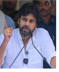
చెప్పారు. భయపడే వాళ్ళమే అయితే రాజకీయ పార్టీని పెడతామా అని పేర్కొన్నారు. తెలంగాణ నడిబొడ్డున జనసేన పుట్టిందని హైదరాబాద్ నడిబొడ్డున పార్టీ ఆవిర్భవించిందని స్పష్టం చేశారు. తెలంగాణకు జనసేన పార్టీ వ్యతిరేకం అని ప్రచారం చేస్తున్నారని తెలంగాణలో లక్ష మంది జనసేనకులు ఉన్నారని గుర్తు చేశారు. తెలంగాణపై తనకు ఉన్న ప్రేమ రాజకీయాలకు అతీతమని పేర్కొన్నారు. తెలంగాణ రాష్ట్ర విభజనకు, సంస్కృతికి జనసేన పార్టీ వ్యతిరేకం కాదని తేల్చి చెప్పిన పవన్ కల్యాణ్ కానీ విభజించిన తీరుకు మాత్రమే

హైదరాబాద్ (ప్రశ్న న్యూస్) జనసేన పార్టీ తలపెట్టిన సగ భర్త్య కావడంతో హైదరాబాద్ జూబిలీహిల్స్లోని తన నివాసంలో ఆంధ్రప్రదేశ్ కివ్వాలి సీఎం, జనసేన అధినేత పవన్ కల్యాణ్ మీడియా సమావేశం నిర్వహించారు. తెలంగాణలో తాను ఎలా తిరుగుతానో చూస్తూంటూ చాలా మంది ఇప్పుడు మాట్లాడుతున్నారని తెలంగాణ కోసం తాను పోరాటాలు చేసినప్పుడు ఈ నాయకుల అంతా ఎక్కడికి పోయారు అని ప్రశ్నించారు. పవన్ కల్యాణ్ ను తెలంగాణకు రానివ్వడం అంటున్నారని ఇదేమైనా మీ ఆయ్యు జాగీరా అంటూ పవన్ కల్యాణ్ నిలదీశారు. తనను బెదిరించడానికి మీరు ఎవరు అంటూ ప్రశ్నించారు. తనను ఎంత తిట్టినా పట్టించుకోనని తనకు తెలంగాణలో కంటే ఆంధ్రప్రదేశ్లోనే బెదిరింపులు ఎక్కువ అని