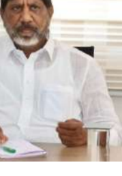
మాట్లాడారు. ఈ సందర్భంగా రాష్ట్ర రాజకీయాలపై ఆయన కొన్ని ఆసక్తికర వ్యాఖ్యలు చేశారు. రాజీయ ఎన్నికల్లో కాంగ్రెస్ పార్టీకి అసలు ప్రత్యర్థులే లేరని

హైదరాబాద్ (ప్రశ్న న్యూస్) ఓటర్ల జాబితా ప్రత్యేక సమగ్ర సవరణ (ఎన్ఐఐఆర్) ప్రక్రియపై మీడియా ప్రత్యేక దృష్టి పెట్టాలని, అర్హతైన వారి ఓట్లు గల్లంతు కాకుండా చూసుకోవాల్సిన బాధ్యత అందరిపై ఉందని తెలంగాణ ఉపముఖ్యమంత్రి మల్ల భట్టి విక్రమార్కు పిలుపునిచ్చారు. ప్రతి ఒక్కరూ ఈ 'ఎన్ఐఐఆర్ మ్యాపింగ్' అలవాటు సీరియస్ గా తీసుకోవాలని ఆయన కోరారు. సచివాలయంలో జరిగిన తెలంగాణ అవతరణ దినోత్సవ వేడుకల అనంతరం ఆయన మీడియాతో చిట్చాట్ గా