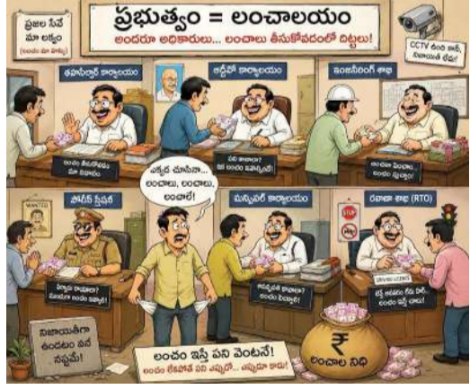
ప్రభుత్వం = లంచాలయం అంటూ అభిప్రాయం... లంచాల తీసుకోవడంలో దిట్ట!

నిపుణుల అభిప్రాయం ప్రకారం, ప్రభుత్వ సేవలను పూర్తిగా ఆన్ లైన్ చేయడం, షెడ్యూల్ కదలింపు డిజిటల్ ట్రాకింగ్ ద్వారా