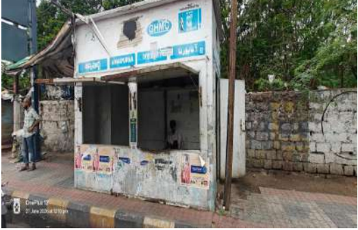
ప్రభుత్వం ఒకవైపు పేదల సంక్షేమం కోసం అన్నపూర్ణ క్యాంటీన్లను గొప్పగా ప్రచారం చేస్తుంటే, మరోవైపు క్షేత్రస్థాయిలో

పక్క రాష్ట్రాల నుంచి పాతాలు నేర్చుకోవాలి పక్క రాష్ట్రాల్లో ప్రజా క్యాంటీన్ల నిర్వహణ పరిశుభ్రంగా, క్రమబద్ధంగా ఉండగా, మన తెలంగాణ రాష్ట్రంలో మాత్రం నిర్వహణపై ఇంత నిర్లక్ష్యం ఎందుకని ప్రజలు ప్రశ్నిస్తున్నారు. మంచి విధానాలను అమలు చేసి అన్నపూర్ణ క్యాంటీన్లను ఆదర్శంగా తీర్చిదిద్దాల్సిన బాధ్యత రేపంతో రెడ్డి ప్రభుత్వంపై ఉందని ప్రజలు అభిప్రాయపడుతున్నారు. ప్రచారానికే పరిమితమా? సమస్యలు తీర్చారా?