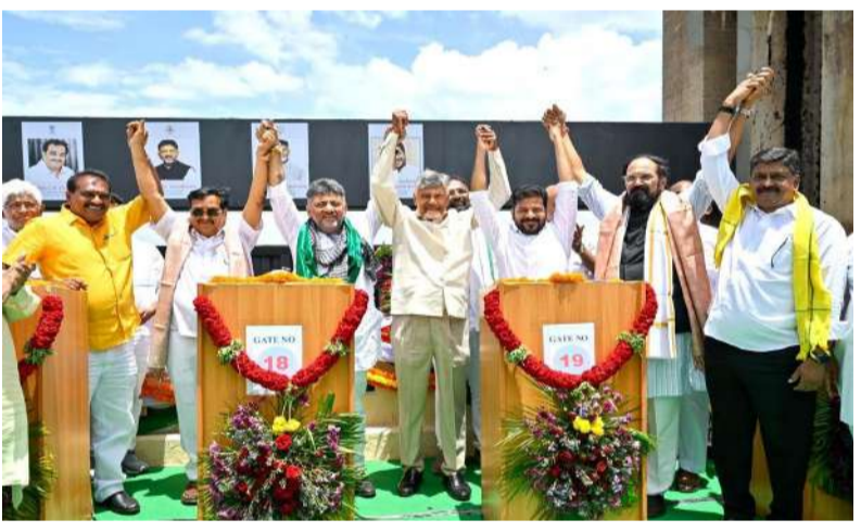
వ్యయంతో ఈ ఆధునిక గేట్ల మార్పిడి

హైదరాబాద్ (ప్రశ్న స్వూస్) రాజకీయాల్లో అత్యంత ఆరుదైన, దక్షిణాది జలవనరుల చరిత్రలోనే ఒక అపూర్వ మైలురాయిగా నిలిచే చారిత్రాత్మక ఘట్టానికి కృష్ణానది ఉపనది అయిన తుంగభద్ర వేదికైంది. కర్ణాటకలోని విజయనగర జిల్లా హోసనపేట సమీపంలో గల మునిరాబాద్ వద్ద తుంగభద్ర జలాశయానికి పూర్తిగా పునరుద్ధరించిన 33 నూతన ప్లైవేజ్ క్రస్ట్ గేట్లను గురువారం ఘనంగా జాతికి అంకితం చేశారు. కేంద్ర జలశక్తి మంత్రి సీఆర్ పాటిల్ నేతృత్వంలో జరిగిన ఈ కార్యక్రమంలో ఆంధ్రప్రదేశ్ ముఖ్యమంత్రి నారా చంద్రబాబు నాయుడు, తెలంగాణ ముఖ్యమంత్రి ఎ. రేవంత్ రెడ్డి, కర్ణాటక ముఖ్యమంత్రి సిద్ధరామయ్య, ఉపముఖ్యమంత్రి డి.కె. శివకుమార్ కలిసి సంయుక్తంగా ఈ గేట్లను ప్రారంభించారు. గతంలో చోటుచేసుకున్న జల వివత్తును సవాల్ గా తీసుకుని, మూడు