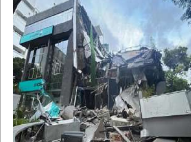
కారకాన్ (ప్రశ్న స్వూస్) వెనిజవెలా కరీబియన్ తీరప్రాంతంలో బుధవారం (జూన్ 24) సాయంత్రం సంభవించిన రెండు వరుస భారీ భూకంపాలు ఆ దేశాన్ని వణికించాయి. రాజధాని కారకాన్ సహా పలు నగరాల్లో భూమి కంపించడంతో అనేక భవనాలు కుప్పకూలాయి. భారీ ఆస్తి నష్టం సంభవించడంతో పాటు కరీబియన్ తీర ప్రాంత దేశాలు సునామీ భయంతో వణికిపోయాయి. ఇప్పటి వరకు 164 మంది