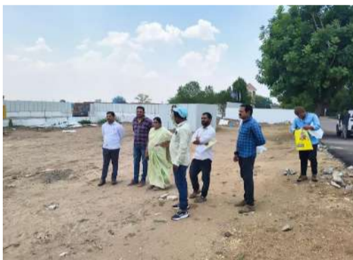
ప్రమాదకర స్థితికి చెరువు కట్ట:

చెరువు కట్ట కింద నిర్మాణాలు చేపట్టాలంటే చెరువు కట్ట నుండి 9 మీటర్ల పరకు (ఎఫ్ డిఎల్, అలాగే బఫర్ జోన్) ఎటువంటి నిర్మాణాలు చేపట్టరాదు, కాసా గ్రాండ్ నిర్మాణ సంస్థ కాసా గ్రాండ్ సీఎర్రా పేరుతో కోతినార్ చేరు కట్టను ఏకంగా సగం కట్టను ధ్వంసం చేసి నాలుగు లైన్ రోడ్డు నిర్మాణానికి తెరలేపడంతోపాటు కట్ట నుండి అప్రోచ్ రోడ్డు నిర్మాణం చేపట్టింది సుమారు 45 ఏకరాలలో విస్తరించిన కోతినార్ చెరువు కేటూగాళ్ళు కట్టను ధ్వంసం చేసి రోడ్డు నిర్మాణం చేపడుతుండడంతో కట్ట ప్రమాద కర స్థాయికి చేరుకుంది. గ్రేట్ హైదరాబాదు పరిధిలోని ప్రధాన జలాశయాలు కట్టకు గురికాకుండా హైద్రా అధికారులు నిధా నియంత్రణలో ప్రత్యేక చర్యలు చేపడుతున్నా బరితెగిస్తున్న బదా నిర్మాణ సంస్థలు చెరువు కట్టను ధ్వంసం చేసి అక్రమ నిర్మాణాలు చేపడుతుండడం పలు అనుమానాలకు తావిస్తుంది. అక్రమ సంపాదనకు అలవాటు పడ్డ కింది స్థాయి ఇరిగేషన్, రెవెన్యూ అధికారుల కను సన్నలేనే సదరు సంస్థలు రెచ్చిపోతున్నట్లు స్థానిక ఆరోపణలు వినిపిస్తున్నాయి.