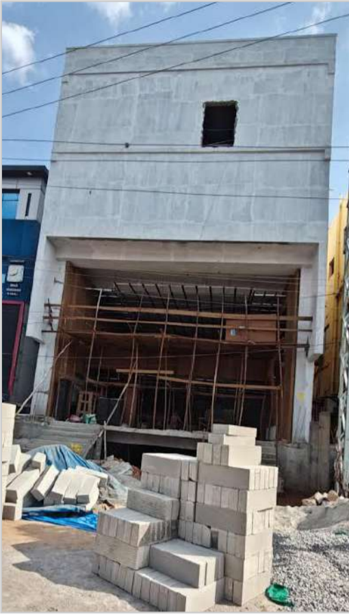
కాప్రా (ప్రశ్న స్కూస్) కాప్రా సర్కిల్ వద్ద అక్రమ నిర్మాణాలు రోజురోజుకూ పెరిగిపోతుండగా, వాటిపై చర్యలు తీసుకోవాల్సి

అధికారులు మాత్రం మౌనంగా ఉండటం అనుమానాలకు తావిస్తోంది. ఎలాంటి నిబంధనలు పాటించకుండా, రెసిడెన్షియల్ అనుమతులతో కమర్షియల్ భవనాలు నిర్మిస్తున్న టౌన్ ప్లానింగ్ అధికారులు చూసే చూడనట్లు వ్యవహరిస్తున్నారని స్థానికులు మండిపడుతున్నారు. ఏఎస్ రావు నగర్ కు వెళ్లే ప్రధాన రహదారిపై, పక్క ఇంటి నంబర్ 1-12-108, ఎల్.బి.బి-4 సమీపంలో భారీ కమర్షియల్ నిర్మాణం కొనసాగుతున్నట్లు స్థానికులు ఆరోపిస్తున్నారు. నిర్మాణానికి మంజూరైన అనుమతులు ఒక విధంగా ఉండగా, స్థలంలో జరుగుతున్న పనులు మరో విధంగా ఉన్నాయని వారు చెబుతున్నారు. ముఖ్యంగా అనుమతుల్లో లేని సెల్లార్ నిర్మాణం చేపట్టినప్పటికీ అధికారులు ఎలాంటి అభ్యంతరాలు వ్యక్తం చేయకపోవడం వెనక లంచాల్లో కారణమన్న ఆరోపణలు వినిపిస్తున్నాయి. స్థానికుల కథనం ప్రకారం, భవన నిర్మాణంలో సెల్లార్లు, పార్కింగ్ నిబంధనలు, వినియోగ మార్పు వంటి అంశాలను పూర్తిగా విస్మరించారని ఆరోపిస్తున్నారు. రెసిడెన్షియల్ పర్మిషన్ పొందిన భవనాన్ని కమర్షియల్ అవసరాలకు అనుగుణంగా నిర్మిస్తున్నారని, దీంతో ప్రభుత్వానికి రావాల్సిన ఫీజులు, చార్జీలు కూడా భారీగా దెబ్బతింటున్నాయని అంటున్నారు. అనుమతి పత్రాలను నిర్మాణం స్థలం వద్ద ఏర్పాటు చేయకపోవడంతో పాటు చైన్ మెన్, సెక్షన్ అధికారి మీడియా అడిగిన ఇవ్వకపోవడం చూస్తుంటే లోపాలు కారి ఒప్పందం ఎంత తీవ్ర స్థాయిలో ఉందో అర్థం చేసుకోవచ్చు అని స్థానికులు మండిపడుతున్నారు.