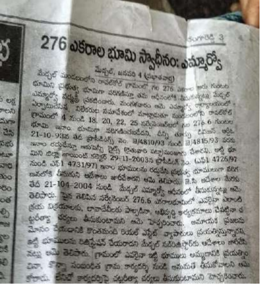
గ్రేజింగ్ ల్యాండ్స్ అయితే ప్రైవేట్ వ్యక్తులకు ఓఆర్పీలు ఇవ్వడానికి వీలేదని తేల్చి చెప్పింది.