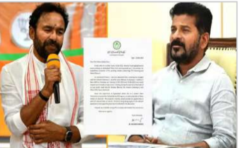
లోపే కేంద్ర రైల్వే శాఖ మంత్రి అశ్వినీ వైష్ణవ్ తో ఉమ్మడి

హైదరాబాద్ (ప్రశ్న స్వాస్) హైదరాబాద్ మెట్రో రైల్ ప్రాజెక్ట్ నిధులు, విస్తరణ మంజూరు అంతం ఇప్పుడు తెలంగాణ రాజకీయాల్లో తీవ్రమైన పోలిటికల్ వార్ కు దారితీసింది. ముఖ్యమంత్రి ఎ. రేవంత్ రెడ్డి జూన్ 20, 2026 నాటి అధికారిక లేఖలో కేంద్ర టౌర్గ్, గనుల శాఖ మంత్రి జి. కిషన్ రెడ్డికి సవాల్ విసురుతూనే ఉమ్మడి పరిష్కారం కోసం ప్రతిపాదనలు పంపారు. జూన్ 22, 23 తేదీల్లో తాను ఢిల్లీ పర్యటనలో ఉంటానని, ఈ