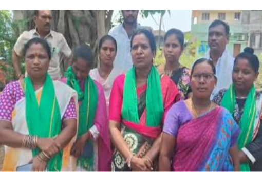
చేస్తున్నారు. అధికారులు తక్షణమే సర్వే నిర్వహించి వాస్తవాలను బయటపెట్టాలని కోరుతున్నారు.

ఇలాంటి చర్యల వల్ల నిజమైన ఆదివాసుల జాతి మీద ఇతరులకు నమ్మకం పోతోంది. గిరిజనుల ఆత్మగౌరవాన్ని