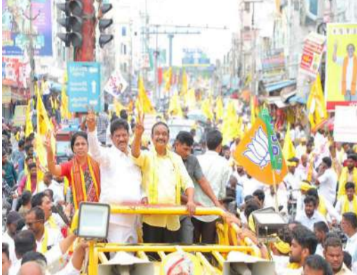
ప్రతిపక్ష పార్టీని మళ్లీ అధికారంలోకి రానివ్వకూడదని అన్నారు.

నిర్వహించడానికి సహకరించిన అందరికీ ధన్యవాదాలు తెలిపారు. ఇచ్చిన అన్ని హామీలను నెరవేర్చారు. రాజీవ్ కాలంలో రాష్ట్రాన్ని అమరావతిని కాపాడుకుంటాం. ద్వైతా మహాశలు, నీటి సంఘాలు, సాస్టెట్ అధ్యక్షులు, మండల నాయకులు ఒక్క పిలుపుతో 24 గంటల్లోనే ఈ కార్యక్రమాన్ని విజయవంతం చేశారు. 2029లో చంద్రబాబు నాయుడుని ఐదోసారి ముఖ్యమంత్రిగా, ఎంపీ లావు శ్రీకృష్ణదేవరాయలు హక్కుల్లోకి విజయంతో మాడోసారి, జిల్లా నాయకులందరినీ మళ్లీ గెలిపించాలని పిలుపునిచ్చారు. ఈ సభను చూసి ప్రతిపక్షాల గుండెల్లో రైళ్లు పరిగెత్తాలన్నారు. ఎస్సీ, ఎస్టీ, బీసీ, మైనార్టీ, కాపు సోదరులు, రైతులు, వ్యాపారవేత్తలకు కృతజ్ఞతలు తెలిపారు. “జై తెలుగుదేశం, జై జనసేన, జై డిజిటీ నినాదాలతో ప్రసంగం ముగించారు.