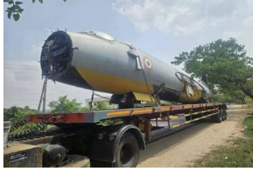
దీంతో నాంపల్లి గుట్ట జిల్లాలో ప్రముఖ టూరిస్ట్ స్పాట్ గా గుర్తింపు పొందే దిశగా అడుగులు వేస్తోంది.