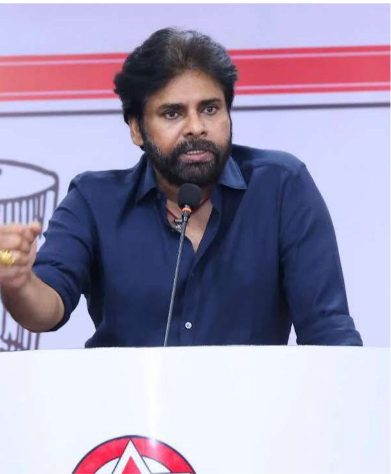
ఆకాంక్షలకు, దేశ సార్వభౌమాధికారానికి మద్దతు ఉండాలని సమతుల్యతను ఈ సమావేశంలో ప్రముఖంగా చర్చించనున్నారు.

దక్షిణాది రాష్ట్రాల ప్రతినిధులతో భారీ క్యాన్సాన్ ఆంధ్రప్రదేశ్, తెలంగాణ రాష్ట్రాలకే పరిమితం కాకుండా కర్ణాటక, తమిళనాడు, కేరళ వంటి ఇతర దక్షిణాది రాష్ట్రాల నుంచి ఇటీవల కాలంలో పార్టీలో చేరిన ముఖ్యులను ఈ సమావేశానికి ప్రత్యేకంగా ఆహ్వానించడం రాజకీయ ప్రాధాన్యతను సంతరించుకుంది. పార్టీకి చెందిన ఎంపీలు, ఎమ్మెల్యేలు, ఎమ్మెల్యేలు, నామినేట్ అయిన కార్పొరేషన్ చైర్మన్లతో పాటు, వివిధ రాష్ట్రాల ముఖ్య నేతలు ఈ మేధోసభలో భాగస్వాములు కానున్నారు. దీని ద్వారా దక్షిణాది రాష్ట్రాల్లో పార్టీ భావజాలాన్ని మరింత బలంగా విస్తరించే వ్యూహం కనిపిస్తోంది.