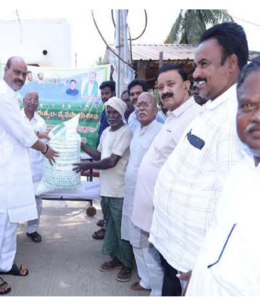
విత్తనాలు, ఎరువుల కొరత, అక్రమ నిల్వలకు తావులేకుండా పారదర్శకంగా పంపిణీ జరిగేలా వ్యవసాయ శాఖ నృప్తమైన ఆదేశాలు జారీ చేసింది.

పరుగులు తీయాల్సిన అవసరం గానీ, పంపిణీ కేంద్రాల చుట్టూ తెల్లవార్లూ క్యూ కట్టాల్సిన తిప్పలు గానీ తప్పనున్నాయి. జిల్లా వ్యాప్తంగా సాగు అవసరాలను తీర్చేందుకు సాగ్రేయంగా గుర్తించి, యుద్ధప్రాతిపదికని విత్తనాలను అందుబాటులో ఉంచారు. శ్రీకాకుళం జిల్లా వ్యాప్తంగానే ఏకంగా 31,058 క్వీంటాళ్ల మేలు రకపు వరి విత్తనాల నిల్వలను ముందస్తుగా సమకూర్చారు. సాగు పెట్టుబడి తగ్గించేందుకు సాధారణ రైతులకు కిలో వరి విత్తనంపై పది రూపాయల రాయితిని అందిస్తుండగా, ఎస్టీ సామాజిక వర్గానికి చెందిన గిరిజన రైతులకు మరింత ఆర్థిక భరోసా కల్పిస్తూ ఏకంగా తొంభై శాతం రాయితిని ప్రభుత్వం భరిస్తోంది.