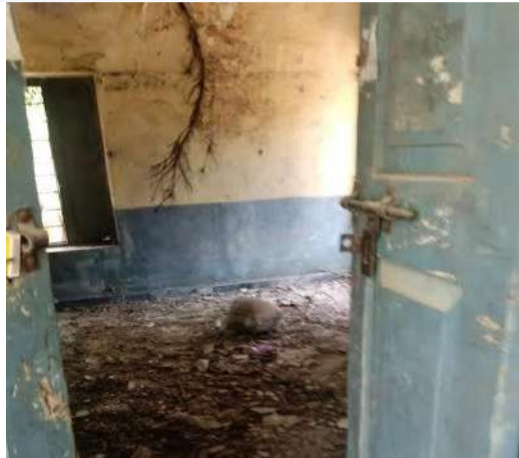
ఇబ్బందులు ఎదురవుతున్నాయి. భోజనం తయారు చేసే వంట గదుల కొరత, గ్యాస్ సిలిండర్ల కొరతతో అన్ని పాఠశాలల్లో

ప్రభుత్వం విద్యార్థుల ఆరోగ్యం మెరుగుపరచే పనిలో భాగంగా మధ్యాహ్న భోజనం అందజేస్తున్న క్రమంలో, క్షేత్రస్థాయిలో అనేక