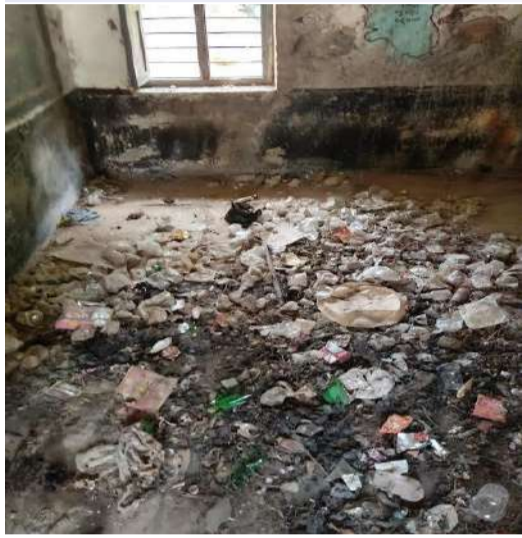
మేడ్చల్(ప్రశ్న స్కూల్) ప్రైవేటు పాఠశాలలకు దీటుగా ప్రభుత్వ పాఠశాలల్లో విద్యను పెంపొందించాలన్న ప్రభుత్వ సంకల్పానికి, అదే సర్కారు నిర్లక్ష్య ధోరణి ప్రధాన కారణంగా కనిపిస్తోంది. ప్రస్తుతం ప్రభుత్వ పాఠశాలల్లోని మౌలిక వసతుల లేమి, ఇతర