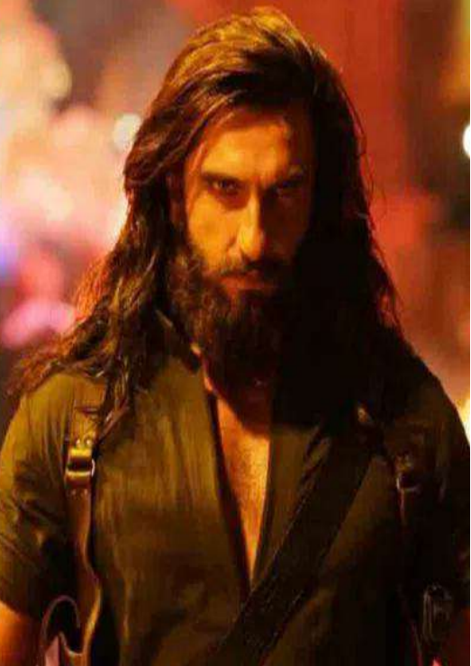
కథ. ఇక 'గదర్ 2' విషయానికి వస్తే, ఈ చిత్రంలో తారా సింగ్ తన కుమారుడు జీతేను రక్షించడం కోసం మరోసారి పాకిస్తాన్ లోకి అడుగుపెడతాడు.