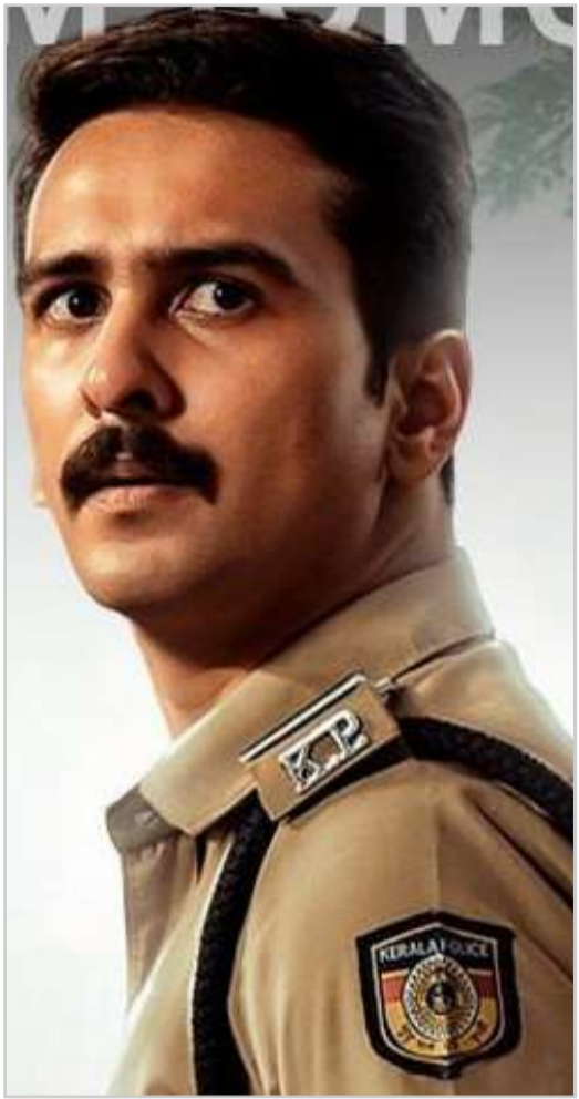
కాకపోతే చివరి అరగంట కోసం, దానికి ముందున్న కథను సాగదీయడమే కాస్త ఇబ్బంది కలిగిస్తుంది. 'పరిస్థితులే కొంతమందిని హిలోలను చేస్తాయి .. మరికొంతమందిని విలన్స్ గా మారుస్తాయి' అనే ఒక డైలాగ్ ఈ సినిమాలో ఉంది. ఆ పరిస్థితులు ఏమిటనేది తెలుసుకోవడానికి ఒక గంటన్నరసేపు ఓపిక పడితే, మిగతా అరగంట కథ ఆ అసంతృప్తిని దూరం చేస్తుందనే చెప్పాలి.

సాధారణంగా చాలా కథలు ఇంటర్వెల్ బ్యాంక్ నుంచి కొత్త మలుపు తీసుకుంటూ ఉంటాయి. అక్కడి నుంచి కథ నెక్స్ టెవెల్ కి వెళతూ ఉంటుంది. కానీ ఈ సినిమాలో అలాంటి ఒక మలుపు ప్రీ క్రెమాట్స్ లో వస్తుంది. అప్పటి వరకూ ఇన్వెస్టిగేషన్ కి సంబంధించిన సన్నివేశాలు .. అనుమానిత పాత్రలు తెరపైకి వచ్చి వెళతూ ఉంటాయి. అయితే ఈ తతంగం మొత్తం సడిచిన తీరు చాలా నిదానంగా అనిపిస్తుంది. సినిమా మొత్తం కూడా చివరి 30 నిమిషాలపై ఆధారపడి నడుస్తుంది. ఈ అరగంట నిడివిలో నడిచే ఎపిసోడ్ కోసమే మిగతా గంటన్నర కథను సాగదీశారని చెప్పొచ్చు. అయితే పోలీసు పాత్రలను పోషించిన ప్రతి ఆర్టిస్ట్ ప్రదర్శించిన నటన రియలిస్టిక్ గా అనిపిస్తూ, మనలను కథ వెంట కదిలేలా చేస్తుంది. మిగతా గంటన్నర కథపై కూడా మరింత కనరత్నం చేసినట్లు, ఇది జీతా జోసెఫ్ సినిమా అంటే నమ్మేసేలా ఉండేది. హత్యలు .. దొంగతనాలు .. అనుమానితులు .. ఇన్వెస్టిగేషన్లు అంటూ గతంలో చాలా సినిమాలు వచ్చి ఉంటాయి. అయితే ఆ సినిమాలలో ఎవరూ చూడని ఒక క్రెమాట్స్ ను .. ఎంతమాత్రం ఊహించని క్రెమాట్స్ ను ఈ సినిమాలో చూడొచ్చు. అరగంటసేపు మనలను కదలనీయకుండా చూసే ఈ క్రెమాట్స్ కోసమే ఈ సినిమాను చూడొచ్చునేమో అనిపించేలా ఉంటుంది. కథాకథనాలు కాస్త నిదానంగానే నడుస్తాయి. అయినా ఆడియన్స్ కి బోర్ కొట్టకుండా చేసినవి ఏమైనా ఉన్నాయంటే అవి లాకేషన్స్ అనే చెప్పాలి. అద్భుతమైన లాకేషన్స్ ఆడియన్స్ ఆకట్ తీరుస్తాయి. ఇక నేపథ్య సంగీతం కూడా సందర్భానికి తగినట్లుగా వెళ తుంది. ఎడిటింగ్ వర్క్ కూడా చాలా సీట్ గా అనిపిస్తుంది. ఇంతవరకూ వచ్చిన పోలీస్ కథలకు ఈ కథ చాలా భిన్నంగా అనిపిస్తుంది చెప్పడంలో ఎలాంటి అతిశయోక్తి లేదు.