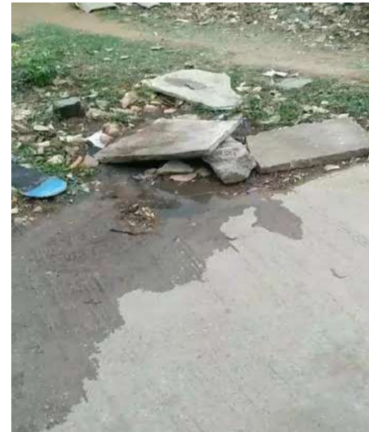
చేశారు. ఇప్పటికైనా మున్సిపల్ ఉన్నతాధికారులు స్పందించి, తక్షణమే రాకూర్ కాలనీని సందర్శించి ఈ డ్రైనేజీ సమస్యకు

కీసర (ప్రశ్న స్వాస్) కీసర సర్కిల్ దమాయిగూడ డివిజన్ పరిధిలోని బండ్లగూడ రాకూర్ కాలనీలో డ్రైనేజీ వ్యవస్థ పూర్తిగా అస్తవ్యస్తంగా మారింది. కాలనీలోని మ్యాన్ హోల్స్ నుండి డ్రైనేజీ నీరు నిరంతరం రోడ్లపైకి పొంగిపొర్లుతుండటంతో స్థానికులు తీవ్ర ఇబ్బందులు ఎదుర్కొంటున్నారు. మురుగునీరు రోడ్లపై నిలిచిపోవడం వలన కాలనీ అంతటా విపరీతమైన దుర్వాసన వ్యాపిస్తోంది. మురుగునీరు రోడ్లపైనే ప్రవహిస్తుండటంతో దోమలు, ఈగలు చేరి రోగాలు వ్యాపించే ప్రమాదం పొంచి ఉందని స్థానికులు భయాందోళన వ్యక్తం చేస్తున్నారు. ముఖ్యంగా చిన్న పిల్లలు అదే మురుగునీటి పక్కనే ఆడుకోవాల్సి వస్తోందని, దీనివల్ల వారు త్వరగా అనారోగ్యాల బారిన పడే అవకాశం ఉందని ఆవేదన చెందుతున్నారు. కాలనీలో అడుగు పెట్టాలన్నా ఇంట్లో ప్రశాంతంగా ఉండాలన్నా ఈ వాసన భరించలేకపోతున్నామని వారు వాపోతున్నారు.