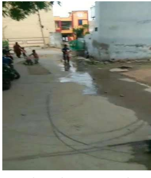
శాశ్వత పరిష్కారం చూపాలని, తమను ఈ నరకప్రాయమైన దుర్వాసన నుండి కాపాడాలని కాలనీ ప్రజలు డిమాండ్ చేస్తున్నారు.