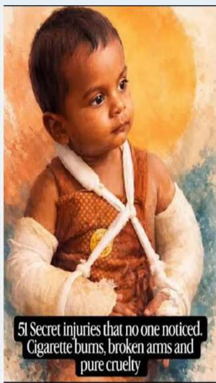
51 Secret injuries that no one noticed. Cigarette burns, broken arms and pure cruelty

ప్రపంచవ్యాప్తంగా ప్రతి వ్యవస్థలోనూ ఎంతో కొంత లోపం కల్గి అవిని తి ఉంటాయి. కానీ ఎలాంటి లోపం లేనిది కల్గి లేనిది అమ్మ ప్రేమ అంటే ఆలోచించాలి అనే రోజులు వచ్చాయి. మన చుట్టూ ఎన్ని బంధాలు ఉన్నా అమ్మ అనే బంధం లేకుంటే మాత్రం మనం అందరూ ఉన్న అనాధలమే. ఇది నా స్వలనుభవం దేవుడు ప్రతి చోట ఉంటాడు కానీ ప్రత్యక్షంగా మనకి కనపడకపోయినా అమ్మ రూపంలో తన ప్రేమను పంచుతాడు ఇది ముమ్మాటికీ నిజం. కానీ ఈరోజుల్లో పరిమితులు లేని క్షణికావేశ కామ కోరికలతో వావి వరసలు నైతికత మర్చిపోయి ప్రవర్తిస్తున్నారూ ఈ విచిత్ర విడితనం వల్ల దుర్మార్గమైన నియంత్రణ లేని ఆలోచనలకు దారితీసి విచక్షణ కోల్పోయి కేవలం శారీరక సుఖానికి విలువ ఇస్తున్నారూ సామాజిక స్పృహతో కూడిన జీవనం సాగిస్తే మానవ జీవితానికి ఒక విలువ ఉంటుంది భూమిపై ఉన్న అన్ని రకాల సాటి జీవులపై అధికారం పెత్తనం మనిషికి మాత్రమే ఉంది కానీ ఈ రోజుల్లో బుద్ధిలో మనకంటే అవేనయం కన్నబిడ్డలను చంపుకోవు మనిషి విలువ అంతకంతకు దిగజారి మనిషివా పశువువా అనే మాట కూడా పోల్చుకోవటానికి మనం సరిపోమేమో కదా అనిపిస్తుంది తాచుపాము కూడా అకస్మాత్తుగా వాతావరణ మార్పులలో విపరీతమైన ఎండలు వల్ల గుడ్డు పొదిగి పరిస్థితులు లేనప్పుడు మాత్రమే తన గుడ్డు తింటుంది ఆఖరికి తాచుపాముతో పోల్చుకోవటానికి కూడా సరిపోము అనిపిస్తుంది. కేరళలో ఏడాదిన్నర బాబుని ఓ తల్లి ప్రియుడుతో కలిసి చంపేసిందనే వార్త ఇలా నాతో ఈ మాటలు పలికించింది నిజంగా హృదయం కలచివేసింది