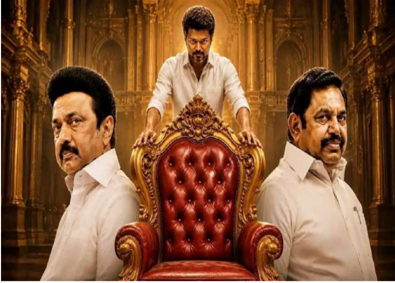
అధికారం కలిపే విజ్ఞప్తి చేయగా మెజార్టీ నిరూపించుకోవాలని చెప్పినట్లు తెలుస్తోంది. అయితే 2 వారాల సమయం ఇస్తే తాను మెజార్టీని నిరూపించుకుంటానని చెప్పినా ప్రభుత్వ ఏర్పాటుకు గవర్నర్ ఆమోదం తెలపలేదని సమాచారం.