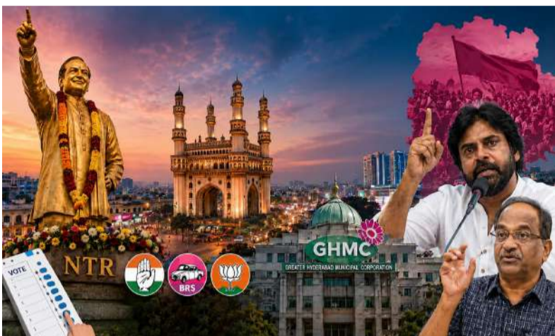
జీహెచ్ఎంసీ ఇప్పుడు కాంగ్రెస్ అధికారంలోకి రాగానే వారికి అనుకూలంగా మారింది. కంటోన్మెంట్, 2లో..

తెలంగాణలో అసెంబ్లీ ఎన్నికల తర్వాత అత్యంత ప్రతిష్టాత్మకంగా భావించే పోరు జీహెచ్ఎంసీ ఎన్నికల్లో రాష్ట్ర జనాభాలో కీలక భాగం హైదరాబాద్లో నివసిస్తోంది. రాష్ట్ర ఆదాయంలోనూ, రాజకీయ ప్రభావంలోనూ, మీడియా దృష్టిలోనూ హైదరాబాద్ ప్రత్యేక స్థానం ఉంది. హైదరాబాద్ను గెలుచుకోవడం అంటే కేవలం కార్యదేవతను గెలుచుకోవడం కాదు. అది ఓ పొలిటికల్ నరేటివ్ ను సృష్టించడం. అందుకే కాంగ్రెస్, బీజేపీ, బీఆర్ఎస్ మూడు పార్టీలూ జీహెచ్ఎంసీని ప్రతిష్టాత్మక పోరుగా చూస్తున్నాయి. గతంలో టీడీపీ బలంగా ఉన్న గ్రేటర్ హైదరాబాద్, తర్వాత బీఆర్ఎస్కు కోటగా మారింది. అదే