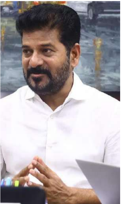
అంతేకాదు, రైతు పండించే ప్రతి గింజను తమ ప్రభుత్వం కొనుగోలు చేస్తుందని పునరుద్ఘాటించారు. కనీసం మద్దతు ధరను నిర్ణయించిన కేంద్రం రైతు పండించిన పంటను కొనుగోలు చేయకపోవడం వల్లే ఈ పరిస్థితి అని అన్నారు. 'రాష్ట్రం కొనుగోలుచేసిన ప్రతి గింజను 2లో..

హైదరాబాద్ (ప్రశ్న స్వాస్) రైతు డిస్కం ఏర్పాటు విషయంలో ప్రతిపక్ష బీఆర్ఎస్ చేస్తున్న ఆరోపణలపై తెలంగాణ ముఖ్యమంత్రి ఎన్ఎంఆర్ రేవంత్ రెడ్డి తీవ్రంగా స్పందించారు. వ్యవసాయ మోటార్లకు మీటర్లు పెట్టినా, ఉచిత విద్యుత్ ను నిలిపివేసినా తాము ఎన్నికల్లో పోటీచేయబోమని ఒకవేళ మీటర్లు బిగించకుండా ఉచిత విద్యుత్ కనసాగిస్తే పోటీ నుంచి బీఆర్ఎస్ తప్పుకుంటుందా? అని సవాల్ విసిరారు. దేశంలో తొలిసారి రైతు డిస్కం ఏర్పాటుచేశామని, 24 గంటలూ నాణ్యమైన విద్యుత్ కోసమేనని తెలంగాణ సీఎం స్పష్టం చేశారు.