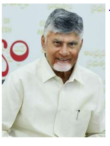
అమరావతి (ప్రశ్న స్వాస్) రాష్ట్రంలో అత్యంత ప్రతిష్టాత్మకంగా, ఘనంగా యోగాంధ్ర-2026 నిర్వహించాలని ముఖ్యమంత్రి చంద్రబాబు నాయుడు నూచించారు. జూన్ 21వ తేదీ అంతర్జాతీయ యోగా దే నిర్వహణకు సంబంధించి మంత్రులు, అధికారులతో సీఎం 2లో..

- యోగాంధ్ర- 2026 పై సీఎం చంద్రబాబు సమీక్ష - అన్ని శాఖల సమన్వయం, కోటి మంది భాగస్వామ్యం - ఒక్కో జిల్లాకు రూ.25 లక్షలు కేటాయింపు - యోగాపై మంతన సత్సనారాయణ రాజు ప్రత్యేక వీడియోలు