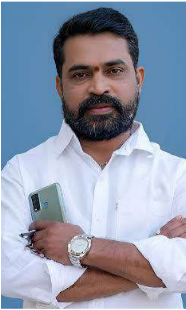
అభినందిస్తూ, యువతకు ఆదర్శంగా నిలుస్తున్నారని కొనియాడుతున్నారు.

ప్రత్యక్షంగా సేవ చేయాలనే ఆకాంక్షను వ్యక్తం చేస్తున్నారు. అలాగే 2017లో పదవీ విరమణ అనంతరం తన స్వగ్రామమైన గంగాదేవిగూడెంలో తన తాతగారి స్మారకార్ధం సొంత ఖర్చులతో రూ.1 లక్ష వ్యయంతో బస్ షెల్టర్ నిర్మించి గ్రామ ప్రజలకు అందించారు. సమాజ సేవలో నిరంతరం ముందుండే కొమ్ము కోటి సేన సేవా కార్యక్రమాలను స్థానికులు