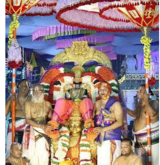
కార్యక్రమాల టీడీపీ హిందూ ధర్మవచార పరిషత్, అన్నమాచార్య ప్రాజెక్ట్, భక్తి సంగీతాలతో అలరించిన సాంస్కృతిక

తిరుపతి(ప్రశ్న న్యూస్) శ్రీ గోవిందరాజస్వామివారి వార్షిక బ్రహ్మోత్సవాల్లో ఐదవ రోజైన బుధవారం రాత్రి నిర్వహించిన విశేష గరుడవాహనసేవ అత్యంత వైభవోపేతంగా జరిగింది. రాత్రి 7 గంటల నుండి 10 గంటల వరకు తనకు ప్రీతిపాత్రమైన గరుడవాహనంపై శ్రీ గోవిందరాజస్వామివారు అలయ నాలుగు మాడవీధుల్లో విహరిస్తూ భక్తులకు దివ్య దర్శనమిచ్చి అనుగ్రహించారు.సర్వభరణ భూషితుడై, దివ్య కాంతులు వెదజల్లుతూ గరుత్మంతునివై వెలసిన శ్రీ గోవిందుడు భక్తులకు కనువిందు చేశారు. "గోవిందా... గోవిందా..." నామస్మరణలతో తిరుపతి మాడవీధులు ఆధ్యాత్మిక పరవశంలో మునిగిపోయాయి. స్వామివారి బ్రహ్మోత్సవాల్లో గరుడవాహనసేవకు విశిష్టమైన స్థానం ఉంది. గరుడవాహనంపై దర్శనమిచ్చే స్వామివారిని భక్తిత్రధలతో దర్శిస్తే మోక్షప్రాప్తి కలుగుతుందని భక్తుల విశ్వాసం. వేదాలు, ఆచార్యులు గరుడుడిని వేదస్వరూపుడిగా వర్ణించారు. గరుత్మంతుని రెక్కలు వేదాల నిత్యత్వానికి, అపారపేయత్వానికి ప్రతీకలని కొనియాడారు.గరుడుని సేవాభావం, మాతృభక్తి, సత్యనిష్ఠ, నిష్కలంకత, ఉపకారగుణం సమాజానికి ఆదర్శప్రాయమని పండితులు పేర్కొన్నారు. జ్ఞానవైరాగాలను కోరుకునే భక్తులు జ్ఞాన, వైరాగ్యరూపమైన రెక్కలతో విహరించే గరుడుని దర్శించి అభీష్టసిద్ధిని పొందుతారని విశ్వసిస్తారు. అందుకే గరుడసేవకు ఎనలేని మహిమ, విశిష్టత ఏర్పడ్డాయి.