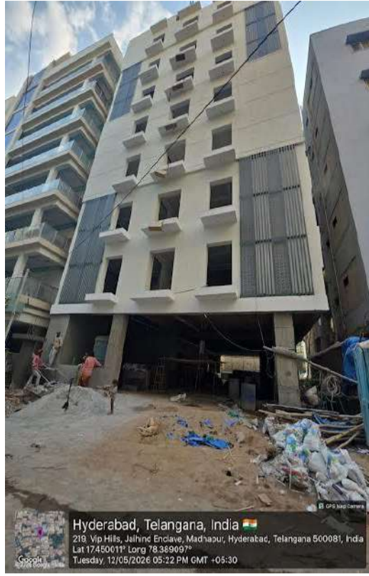
Hyderabad, Telangana, India 218 Vip Hills, Jhiling Enclave, Madhapur, Hyderabad, Telangana 500081, India Lat:17.450111 Long:78.389697 Tuesday, 12/05/2026 05:32 PM GMT +05:30

నిర్మాణాలపై చర్యలు తీసుకోవాల్సిందిగా సెటిల్మెంట్లకు పరిమితమవుతున్నారని స్థానికులు ఆరోపిస్తున్నారు. ఫిర్యాదులు చేసినా స్పందన లేదు.. టౌన్ ప్లానింగ్ అధికారులు వచ్చి చూసి వెళ్లిపోతున్నారని కానీ పని మాత్రం ఆగడం లేదు. దీని వెనుక ఎవరి అండదండలు ఉన్నాయి.? ఏసీపీకి ఎంత ఫిర్యాదులు లంచాలు అందాయి.? అని స్థానికులు ప్రశ్నిస్తున్నారు. అక్రమ నిర్మాణం కారణంగా రహదారులపై ట్రాఫిక్ డైస్టర్బెన్స్ పెరగడంతో పాటు భవిష్యత్తులో పార్కింగ్, డ్రైనేజీ, ట్రాఫిక్ సమస్యలు మరింత తీవ్రం అయ్యే అవకాశం ఉందని స్థానికులు ఆందోళన వ్యక్తం చేస్తున్నారు. మరోవైపు, మాదాపూర్ సర్కిల్ కార్యాలయంలో కొంతమంది అధికారుల పనితీరుపై ఇప్పటికే పలు విమర్శలు ఉన్నాయని, అక్రమ నిర్మాణాల విషయంలో బాధ్యతారహితంగా వ్యవహరిస్తున్నారనే ఆరోపణలు కూడా వినిపిస్తున్నాయి. చిన్న నిర్మాణాలపై కఠిన చర్యలు తీసుకుంటూ, పెద్ద నిర్మాణాల విషయంలో మాత్రం చూసి చూడనట్టుగా వ్యవహరించడం వెనుక లంచాలే కారణమా.? అనలు మర్కమెంటుని ప్రజలు ప్రశ్నిస్తున్నారు. ఇప్పటికైన సైబరాబాద్ మున్సిపల్ కమిషనర్ ప్రత్యేక దృష్టి సారించి ప్లాట్ నెంబర్ 218లో జరుగుతున్న నిర్మాణంపై సమగ్ర విచారణ జరిపించాలని స్థానికులు డిమాండ్ చేస్తున్నారు. నిర్మాణానికి సంబంధించిన అనుమతులు వివరాలను