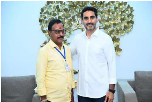
ఈ బాధ్యతను కూటమి ప్రభుత్వం నెరవేర్చాల్సిందే అన్నారు.

సీఎం చంద్రబాబు నాయుడు నాయకత్వంపై విశ్వాసంతో రాష్ట్ర వ్యాప్తంగా బెస్టులు డిడిపీ జనసేన కూటమికి బలమైన అండగా నిలిచారు. ఈ నేపథ్యంలో మా సమాజం సామాజిక న్యాయం మరియు రాజకీయ ప్రాతినిధ్యం కోరుకోవడం సహజమైనదేనని,