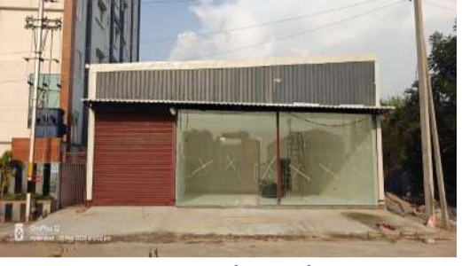
భయభ్రాంతులకు గురిచేస్తున్నారనే విమర్శలు వ్యక్తమవుతున్నాయి.

ఉప్పల్ (ప్రశ్న న్యూస్) ఉప్పల్ సర్కిల్ అంటేనే అవినీతి అక్రమాలకు కేంద్రంగా మారింది. అధికారుల లంచాల దాహానికి ఎటుచూసినా అవినీతి, అక్రమాలు జోరుగా జరుగుతున్నాయని ఇందులో కొంతమంది రాజకీయ నాయకులు బ్రోకర్లుగా వ్యవహరిస్తూ ప్రభుత్వ ఆదాయానికి గండి కొడుతున్నారని ప్రజలు ఆరోపిస్తున్న పట్టించుకునే దిక్కు లేకుండా పోయింది. ఉప్పల్ భగవత్ పరిధిలో అక్రమ షెడ్లు, అనుమతులు లేని నిర్మాణాలు రోజురోజుకూ పెరుగుతున్నాయని స్థానికులు తీవ్ర ఆగ్రహం వ్యక్తం చేస్తున్నారు. జిహెచ్ఎస్సీ అనుమతులు లేకుండా భారీ షెడ్లు, గోదాములు, వాణిజ్య నిర్మాణాలు వెలుస్తున్నప్పటికీ టౌన్ ప్లానింగ్ అధికారులు లంచాలు తీసుకొని కళ్ళుమూసుకుని చూస్తున్నారని ఆరోపణలు వెల్లువెత్తుతున్నాయి. మున్సిపల్ నిబంధనలు పేదలకు మాత్రమేనా? దబ్బాలు ఇచ్చేవారికి చట్టాలు వర్తించనా? అంటూ ప్రజలు మండిపడుతున్నారు.