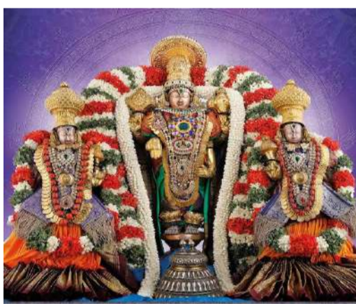
చిరస్మరణగా పద్మావతి అమ్మవారి తండ్రి ఆకాశరాజు ఈ ఆలయాన్ని నిర్మించారని భక్తుల విశ్వాసం. అందుకే ఈ క్షేత్రం కల్యాణ మహిమను ప్రసరించే పవిత్ర దివ్యక్షేత్రంగా యుగయుగాలుగా భక్తుల ఆధారనలను అందుకుంటోంది.