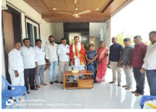
ఇలాంటివి ఎన్నో జరుపుకోవాలని ప్రజల హృదయాల్లో విరసాయంగా నిలిచి ఉండాలని ప్రజలందరి ఆశీస్సులు మీకు ఉండాలని మనస్ఫూర్తిగా కోరుకుంటున్నాము