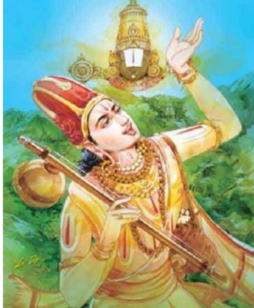
వాద్య కార్యక్రమాలు జరుగనున్నాయి.

విగ్రహం వద్ద మే 2వ తేదీ సాయంత్రం 6.30 గంటలకు ఊజల్ సేవ జరుగనుంది. అదేవిధంగా మే 2 నుండి 8వ తేదీ వరకు సాయంత్రం 6.30 నుండి రాత్రి 8.30 గంటల వరకు సంగీత, వాద్య, హరికథ కార్యక్రమాలు జరుగనున్నాయి. తిరుపతిలో.. తిరుపతిలోని అన్నమాచార్య కళామందిరంలో మే 2వ తేదీ ఉదయం 9 గంటలకు సప్తగిరి సంగీతం గోష్టిగానంతో జయంతి ఉత్సవాలు ప్రారంభమవుతాయి. ఉదయం 10 నుండి 11.30 గంటల వరకు సంగీత సభ, ఉదయం 11.30 నుండి మధ్యాహ్నం 1 గంట వరకు హరికథ గానం జరుగనుంది. మే 3 నుండి 7వ తేదీ వరకు ఉదయం 10.30 నుండి మధ్యాహ్నం 1 గంట వరకు సాహిత్య సదస్సులు జరుగనున్నాయి. మే 8వ తేదీ ఉదయం 8 గంటలకు శ్రీ కోదండరామస్వామివారి ఆస్థానం నిర్వహించనున్నారు. ఉదయం 10 నుండి మధ్యాహ్నం 1 గంట వరకు సంగీత సభ, హరికథ గానం జరుగనుంది. ఇందులో భాగంగా మే 2 నుండి 8వ తేదీ వరకు ప్రతి రోజు సాయంత్రం 6 నుండి రాత్రి 8 గంటల వరకు గాత్ర సంగీతం, నృత్య, వాద్య, హరికథ కార్యక్రమాలు జరుగనున్నాయి. మహతి కళాక్షేత్రంలోనూ మే 2 నుండి 8వ తేదీ వరకు సాయంత్రం 6 నుండి రాత్రి 8 గంటల వరకు సంగీత, నృత్య,