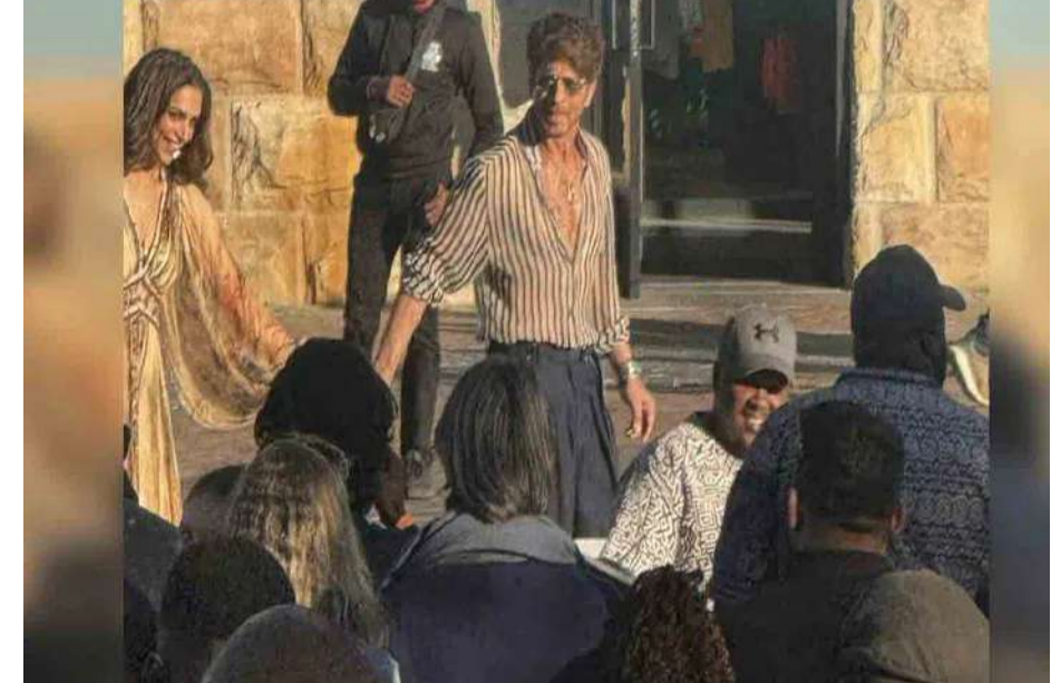
బాలీవుడ్ బాద్ షారుఖ్ ఖాన్, స్టార్ హీరోయిన్ దీపికా పదుకొణె మళ్ళీ కలిసి వెండితెరపై మ్యూజిక్ చేయడానికి సిద్ధమవుతున్నారు. వీరిద్దరూ జంటగా సిద్ధార్థ్ ఆనంద్ దర్శకత్వంలో అత్యంత భారీ బడ్జెట్ తో తెరకెక్కుతున్న హై-ఓట్ల యాక్షన్ డ్రామా 'కింగ్'. ఈ సినిమా షూటింగ్ ప్రస్తుతం దక్షిణాఫ్రికాలోని కేప్ టౌన్ లో శరవేగంగా జరుగుతోంది. తాజాగా కేప్ టౌన్ వీధుల్లో వీరిద్దరూ కలిసి ఉన్న ఫోటోలు సోషల్ మీడియాలో లీక్ అయ్యి నెట్టింట్ లో వివరీతంగా వైరల్ అవుతున్నాయి. ఈ ఫోటోలో షారుఖ్ ఖాన్ 'సాల్ట్ అండ్ పెప్పర్' లుక్ లో ఎంతో స్టైలిష్ గా కనిపిస్తుండగా, గర్భవతి అయిన దీపికా పదుకొణె తన బ్రెగ్గెస్టివ్ గ్లోతో మెరిసిపోతూ షూటింగ్ లో స్పాల్సండం అందరినీ ఆకట్టుకుంటోంది. వీరిద్దరి మధ్య ఒక రొమాంటిక్ సాంగ్ లేదా సినిమాకు అత్యంత కీలకమైన సన్నివేశాలను అక్కర్ల చిత్రీకరిస్తున్నట్లు సినీ వర్గాల సమాచారం. దాదాపు రూ. 350 కోట్ల భారీ బడ్జెట్ తో రాబోతున్న ఈ సినిమా ద్వారా షారుఖ్ కు మరొక సుపర్ హిట్ వెండితెరకు పరిచయం కాలేతుండటం విశేషం. ఇక పవర్ ఫుల్ విలన్ పాత్రలో అభిషేక్ బచ్చన్ కనిపిస్తుండగా, సెన్సేషనల్ మ్యూజిక్ డైరెక్టర్ అనిరుద్ రవిచందర్ ఈ చిత్రానికి సంగీతాన్ని అందిస్తున్నారు. షారుఖ్ మరియు దీపికా కాంబినేషన్ అంటేనే బాక్సాఫీస్ దగ్గర రికార్డుల వేట మొదలవుతుందని అభిమానులు ఇప్పటికే భారీ అంచనాలు పెట్టుకున్నారు. ఈ ప్రతిష్టాత్మక చిత్రాన్ని 2026 డిసెంబర్ 24న క్రిస్మస్ కానుకగా ప్రపంచవ్యాప్తంగా విడుదల చేసేందుకు మేకర్స్ అన్ని ఏర్పాట్లు చేస్తున్నారు.

- 'కింగ్' షూటింగ్ తో హీటెక్కిన దక్షిణాఫ్రికా!