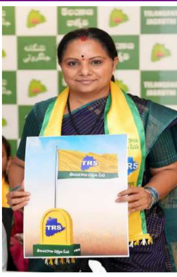
ప్రతినిందించేలా రూపొందించిన ఈ గడ్డెలు, రాసున్న రోజుల్లో

హైదరాబాద్ (ప్రశ్న న్యూస్) హైదరాబాద్ వేదికగా తెలంగాణ రక్షణ సేన పార్టీ తన రాజకీయ ప్రస్థానంలో మరో కీలక అడుగు వేసింది. పార్టీ అన్నితానికి ప్రతీకగా భావించే అధికారిక జెండా గడ్డె నమూనాను ఆ పార్టీ అధినేత్రి కవిత ఆవిష్కరించారు. రాష్ట్రవ్యాప్తంగా పార్టీకి ఒకే విధమైన జెండా ఇమేజీను తీసుకురావడమే లక్ష్యంగా రూపొందించిన ఈ సరికొత్త డిజైన్ ఆత్మధికంగా పసుపు రంగులో ఉండటం ఇప్పుడు రాజకీయ వర్గాల్లో హాట్ టాపిక్ గా మారింది.