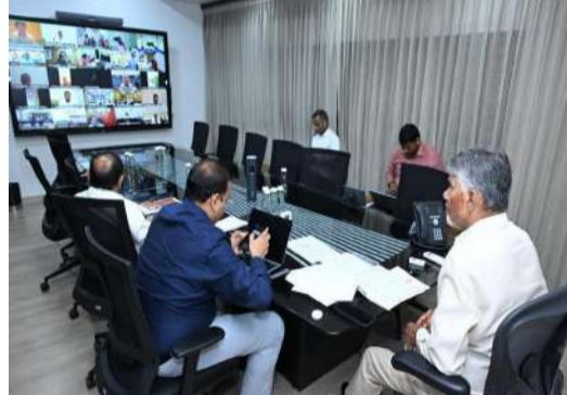
కార్యకర్తల భాగస్వామ్యం కోసం క్లస్టర్ల వారి ఏర్పాట్లు

అమరావతి(ప్రశ్న న్యూస్) తెలుగుదేశం పార్టీ ఎంతో ప్రతిష్టాత్మకంగా నిర్వహించే పనుల పండుగ 'మహానాడు'ను ఈ ఏడాది హైద్రాద్ పద్ధతిలో చేపట్టాలని కీలక నిర్ణయం తీసుకున్నారు. దేశంలో ప్రత్యేక పరిస్థితులు నెలకొన్న దృష్ట్యా, ప్రధాని సూచనలు చేసిన క్రమంలో నెల్లూరులో జరిపే మహానాడు నిర్వహణపై గత 2 రోజుల నుంచి చర్చ జరుగుతోంది. తెలుగు రాష్ట్రాలలో పాటు అందమాన్ నుంచి తెలుగుదేశం పార్టీ ప్రతినిధులు మూడు రోజుల మహానాడు కార్యక్రమానికి హాజరు కావాల్సి ఉంటుంది. ఈ క్రమంలో నెల్లూరులో మూడు రోజుల మహానాడు నిర్వహణకు పెద్ద ఎత్తున వాహినాలను వినియోగించాల్సి వస్తోంది. ప్రధాని సూచనల మేరకు పొదుపు మంత్రి పాటింబాలిని రాష్ట్ర ప్రభుత్వం ఇప్పటికే పిలుపు ఇచ్చింది. ఈ మేరకు స్వయంగా సీఎం చంద్రబాబు, డిప్యూటీ సీఎం పవన్ కళ్యాణ్, మంత్రి నారా లోకేశ్ సహా ఇతర మంత్రులు, ప్రజా ప్రతినిధులు పొదుపు చర్యలు మొదలుపెట్టారు. తమ కాన్వాయిలోని వాహనాలను తగ్గించుకున్నారు. ఈ పరిస్థితుల్లో నెల్లూరులో మూడు రోజుల మహానాడు కోసం అందరూ సమావేశం కావడం దీని కోసం పెద్ద ఎత్తున వాహనాలను వినియోగించడం సబబు కాదనే అభిప్రాయాన్ని టీడీపీలోని కొందరు నేతలు వ్యక్తం చేశారు. దీంతో శుక్రవారం