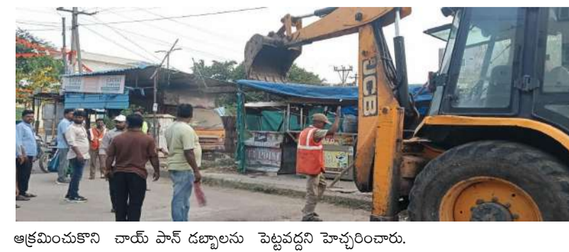
ఆక్రమించుకొని చాయ్ పాన్ డబ్బాలను పెట్టవద్దని హెచ్చరించారు.

మేడ్చల్ (ప్రశ్న న్యూస్) మేడ్చల్ నర్సిల్ పరిధిలోని కేఎల్ఆర్ వెంచర్స్ రోడ్డును ఆక్రమించుకొని వెలిసిన అక్రమ పాన్, పాన్ డబ్బాలను తొలగించారు. కేఎల్ఆర్ వెంచర్స్ లోని శిశివా విగ్రహం వద్ద రోడ్డును ఆక్రమించుకొని పలు చాయ్, పాన్ డబ్బాలు వెలిశాయి. దీంతో రోడ్డు ఇరుకుగా మారడం ట్రాఫిక్ కు ఇబ్బంది కలుగుతుండడంతో మేడ్చల్ టౌన్ ప్లానింగ్ సిబ్బంది జెసిబి సహాయంతో తొలగించారు. రోడ్డుకు ఇరువైపులా ఉన్న అక్రమ పాన్, చాయ్ డబ్బాలు తొలగి తొలగిపోవడంతో ఆ ప్రాంతం విశాలంగా మారి ట్రాఫిక్ ఇబ్బందులు తొలగిపోవడంతో స్థానికులు మున్సిపల్ అధికారులకు కృతజ్ఞతలు తెలిపారు. ఈ సందర్భంగా టౌన్ ప్లానింగ్ సిబ్బంది మాట్లాడుతూ ఎవరు రోడ్డును