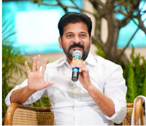
సీఎం రేవంత్ రెడ్డి ధ్వజమెత్తారు.

ప్రభుత్వ అనాలోచిత, నిర్లక్ష్యపూరితమైన నిర్ణయాలు దేశ యువత భవిష్యత్తును ప్రస్తావించే సందర్భంగా చేసినందుకు మండిపడ్డారు. వ్యవస్థీకృతంగా పేపర్ లీక్లు, ప్రభుత్వ వైఫల్యాలు, దేశ యువతను తీవ్ర అనిశ్చితి, నిరాశలోకి నెట్టాయని సీఎం రేవంత్ రెడ్డి చెప్పుకొచ్చారు. తీవ్ర ఒత్తిడిలో సంవత్సరాల తరబడి కష్టపడి చదువుకున్న విద్యార్థుల కలలు మోడి ప్రభుత్వ నిర్లక్ష్యం కారణంగా ప్రస్తుతం కల్లెలయ్యాయని సీఎం రేవంత్ రెడ్డి అందోళన వ్యక్తం చేశారు. ఎంతోమంది విద్యార్థులు తల్లిదండ్రులు అప్పులు చేసి, కొంతమంది తల్లిదండ్రులు నగలు అమ్మి తమ పిల్లలను సీట్ ఎగ్జామెన్టు ప్రాజెక్టు చేయించారని వారి ఆశలన్నీ గల్లంతమైతే బాధాకరం అని సీఎం రేవంత్ రెడ్డి చెప్పుకొచ్చారు. 2019 నుండి 15 రాష్ట్రాల్లో ప్రధాన నియామక పరీక్షల పేపర్ లీక్ అయినా ఒక్క కేంద్ర మంత్రి కూడా రాజీనామా చేయలేదని సీఎం రేవంత్ రెడ్డి గుర్తు చేశారు. బీజేపీ పాలిత రాష్ట్రాలే ఈ లీక్లకు ప్రధాన కేంద్రాలుగా మారాయని గుజరాత్ రాష్ట్రంలోనే 14 పేపర్ లీక్ అయ్యాయని