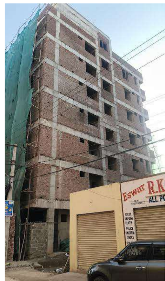
విక్రమించిననీ హెచ్చరించారు. ఒక్కొక్క టౌన్ ప్లానింగ్ అధికారి కూడబెట్టిన కోట్లాది అక్రమ అస్తుల చిట్టాను బయటకు తీస్తామని, అక్రమ నిర్మాణాల పునాదులు కదిలిస్తామని హెచ్చరించారు. మున్సిపల్ అధికారుల అవినీతితో ప్రభుత్వ ఆదాయానికి భారీ గండి పడుతుంటే చూస్తూ ఉబురకొలేమను ముఖ్యంగా ఈ మూడు భవనాల విషయంలో కమిషనర్ తక్షణమే జోక్యం చేసుకుని క్షేత్రస్థాయిలో పరిశీలన జరపాలి. అవినీతి అధికారుల అండతో సాగుతున్న ఈ అక్రమ సామ్రాజ్యాన్ని కూల్చివేయాలని, బాధ్యులను కఠినంగా శిక్షించాలని డిమాండ్ చేశారు. ముఖ్యమంత్రి రేవంత్ రెడ్డి ప్రభుత్వం అవినీతిపై ఉక్కుపాదం మోపుతుంటే, శేరిలింగంపల్లి అధికారులు మాత్రం పాత పద్ధతుల్లోనే భారీగా వసూళ్లకు పాల్పడుతున్నారు. సూరన్న నేతృత్వంలో సాగే ఈ పోరాటం ద్వారా, అక్రమ నిర్మాణాలకు అండగా నిలుస్తున్న అధికారుల అసలు స్వరూపాన్ని బయట పెడతామన్నారు. ఇకనైనా అధికారులు తమ తీరు మార్చుకోకుంటే పరిణామాలు తీవ్రంగా ఉంటాయని హెచ్చరిస్తున్నాము.

ఫిర్యాదు చేసినా క్షేత్రస్థాయిలో చర్యలు తీసుకోకపోవడం వెనుక అధికారుల హస్తం ఉందనే అనుమానాలు బలపడుతున్నాయి. మున్సిపల్ కమిషనర్ స్పందించి టౌన్ ప్లానింగ్ అధికారుల అవినీతి పై వస్తున్న అనేక ఫిర్యాదులను ప్రత్యేకంగా పరిశీలించి, నడరు భవనాల నిర్మాణాలను తక్షణమే నిలిపివేయాలని డిమాండ్ చేశారు. అక్రమ నిర్మాణాలకు కొమ్ముకాస్తున్న టౌన్ ప్లానింగ్ అధికారుల తీరు వల్ల వ్యవస్థ ప్రస్తుత పడుతోందని ప్రజావాణిలో అందిన అక్రమ భవనాల ఫిర్యాదులను బుట్టదాఖలు చేసిన అధికారులపై కూడా చర్యలు