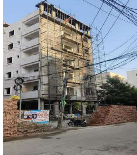
విక్రమించిననీ హెచ్చరించారు. ఒక్కొక్క టౌన్ ప్లానింగ్ అధికారి కూడబెట్టిన కోట్లాది అక్రమ అస్తుల చిట్టాను బయటకు తీస్తామని, అక్రమ నిర్మాణాల పునాదులు కదిలిస్తామని హెచ్చరించారు. మున్సిపల్ అధికారుల అవినీతితో ప్రభుత్వ ఆదాయానికి భారీ గండి పడుతుంటే చూస్తూ ఉబురకొలేమను ముఖ్యంగా ఈ మూడు భవనాల విషయంలో కమిషనర్ తక్షణమే జోక్యం చేసుకుని క్షేత్రస్థాయిలో పరిశీలన జరపాలి. అవినీతి అధికారుల అండతో సాగుతున్న ఈ అక్రమ సామ్రాజ్యాన్ని కూల్చివేయాలని, బాధ్యులను కఠినంగా శిక్షించాలని డిమాండ్ చేశారు. ముఖ్యమంత్రి రేవంత్ రెడ్డి ప్రభుత్వం అవినీతిపై ఉక్కుపాదం మోపుతుంటే, శేరిలింగంపల్లి అధికారులు మాత్రం పాత పద్ధతుల్లోనే భారీగా వసూళ్లకు పాల్పడుతున్నారు. సూరన్న నేతృత్వంలో సాగే ఈ పోరాటం ద్వారా, అక్రమ నిర్మాణాలకు అండగా నిలుస్తున్న అధికారుల అసలు స్వరూపాన్ని బయట పెడతామన్నారు. ఇకనైనా అధికారులు తమ తీరు మార్చుకోకుంటే పరిణామాలు తీవ్రంగా ఉంటాయని హెచ్చరిస్తున్నాము.