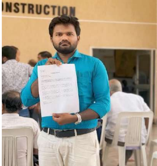
తీసుకోవాల్సిన సూరన్న కమిషనర్ సు కోరారు. ఈ అక్రమాలపై సూరన్న రాజీలేని పోరాటానికి సిద్ధమయ్యారు. ప్రజావాణిలో ఇచ్చిన ఫిర్యాదులపై అధికారులు స్పందించకుంటే, బాధితుల పక్షాన నిలబడి అధికారుల అంతు చూసే వరకు సూరన్న