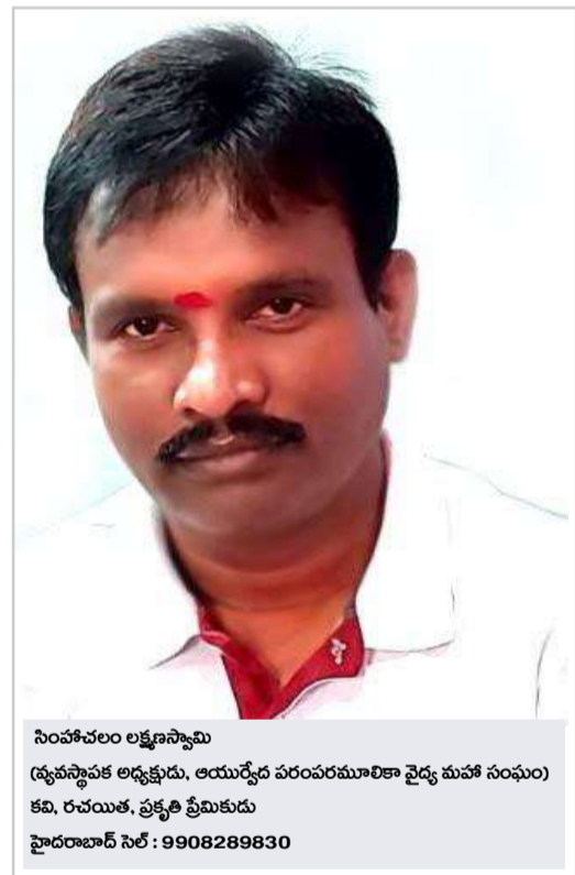
నివేచనం లక్ష్యాన్ని (స్వచ్ఛమైన అద్వైతం, ఆయుర్వేదం పరంపరమాలికా వైద్య మహా సంఘం) కవి, రచయిత, ప్రకృతి ప్రేమికుడు హైదరాబాద్ నె: 9908289830

అందరి బాధ్యత. మన చేతల వల్ల పర్యావరణం దెబ్బతింటే, మన చేతులతోనే దాన్ని సరిచేయగలం. ప్రకృతి మనకు ఏమీ అడగదు. స్వచ్ఛమైన గాలి, నీరు, ఆహారం ఇస్తుంది. మనం దాన్ని కాపాడితే అది మనల్ని కాపాడుతుంది. ప్రకృతికి దూరమైన రోజు నుండే మన ఆరోగ్యం దూరమైంది. ప్రకృతికి తిరిగి చేరుకున్న రోజు నుండే మన ఆరోగ్యం తిరిగి వస్తుంది. ఇది ఆయుర్వేదం చేసిన సత్యం. ఇది నేటి శాస్త్రం నిరూపించిన వాస్తవం. ఇది ప్రకృతి మనకు ఇస్తున్న హెచ్చరిక. మేల్కొనండి. మీ పిల్లలను కాపాడుకోండి. ప్రకృతిని రక్షించండి.