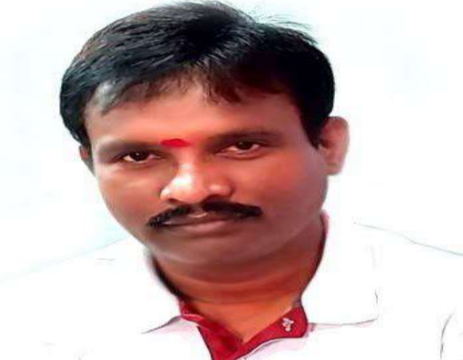
వ్యవస్థాపక అధ్యక్షులు ఆయుర్వేద పరంపర మూలిక వైద్య మహా సంఘం, హైదరాబాద్ దూరవాణి: 9908289830