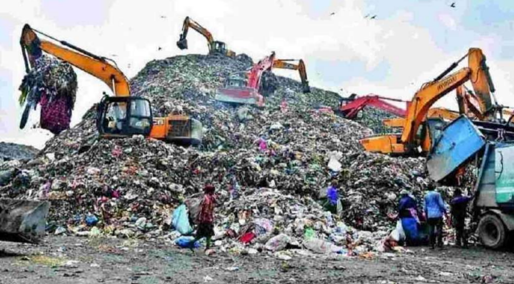
హైదరాబాద్ (ప్రశ్న న్యూస్) జవహర్ నగర్ డంపింగ్ యార్డ్ పెను ముప్పుగా పరిణమించినది ఓ అంతర్జాతీయ నివేదిక విషవాయువుల గనిగా మారినది, ఇది హైదరాబాద్ నగరానికి హెచ్చరించింది. యూనివర్సిటీ ఆఫ్ కాలిఫోర్నియా (లాస్

ఎంజెలెస్) సాఫ్ట్ మీథేన్ ప్రాజెక్టులో భాగంగా జరిపిన పరిశీలనలో ఈ యార్డ్ నుంచి గంటకు 5.9 టన్నుల మీథేన్ గ్యాస్ వెలువడుతున్నట్లు తేలింది. ప్రపంచవ్యాప్తంగా అత్యధిక మీథేన్ ఉద్గారాలు వెలువడుతున్న 25 ప్రాంతాల్లో జవహర్ నగర్ నాలుగో స్థానంలో నిలవడం పరిస్థితి తీవ్రతకు అద్దం పడుతోంది. ఈ యార్డ్ వల్ల తమ ఆరోగ్యాల దెబ్బతింటున్నాయని, భూగర్భ జలాల కలుషితమవుతున్నాయని స్థానికులు ఎన్నో ఏళ్ళుగా చెప్పినప్పటికీ అధికారులు ఈ నివేదిక బలం చేకూర్చింది. నిపుణుల అంచనా ప్రకారం జవహర్ నగర్ నుంచి వెలువడుతున్న మీథేన్ ఉద్గారాలు ఏకకాలంలో 10 లక్షల కార్లు ప్రయాణించినా లేదా 500 మెగావాట్ విద్యుత్ ఉత్పత్తి బొగ్గును మండించినా వెలువడే కాలుష్యంతో సమానం. ఈ జాబితాలో ముంబైలోని ఓ డంపింగ్ యార్డ్ గంటకు 4.9 టన్నుల మీథేన్ తో 12వ స్థానంలో ఉంది. వ్యర్థాల నిర్వహణ శాస్త్రీయంగా జరుగుతోందంటూ జీహెచ్ఎస్ఐ, రాంకీ ఎస్కోతో సంస్థలు చేస్తున్న ప్రకటనలు పూర్తిగా అవాస్తవమని ఈ గణాంకాలు స్పష్టం చేస్తున్నాయి. ప్రస్తుతం నగరంలోని మూడు కార్పొరేషన్ల నుంచి రోజూ సగటున 9,600 టన్నుల చెత్త జవహర్ నగర్ కు చేరుతోంది.