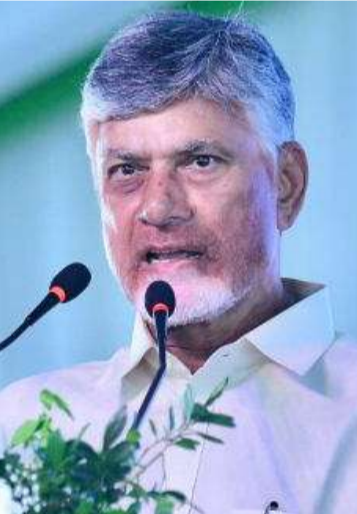
హత్యలు చేసే కిల్లర్ పార్టీ అని

గురించి ప్రజలను అప్రమత్తం చేయాల్సి వస్తోందని ఆయన అన్నారు. అసకాపల్లిన జిల్లా రాంబిల్లో గురువారం రెస్కూ ఎనర్జీ గోల్డ్ సందర్భం చెందిన రెండు షాంట్లకు భూమిపూజ చేసిన అనంతరం ఏర్పాటు చేసిన సభలో చంద్రబాబు మాట్లాడారు. ఈ సందర్భంగా ఆయన గత ప్రభుత్వ తీరును, ప్రతిపక్ష నేతల వైఖరిని తీవ్రంగా ఎండగట్టారు.