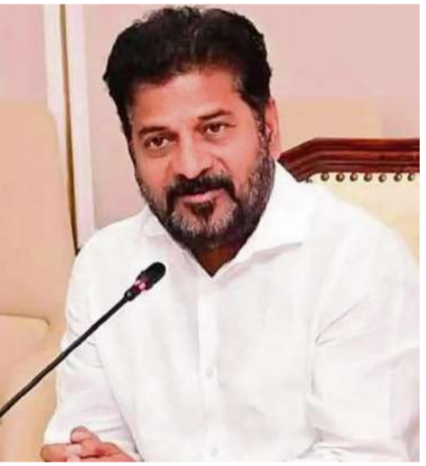
సీఎం రేవంత్ రెడ్డి కీలక వ్యాఖ్యలు చేశారు. ఆర్టీసీ

హైదరాబాద్ (ప్రశ్న స్వాస్) ఆర్టీసీ కార్మికులు తొందరపడి ఎలాంటి కఠిన నిర్ణయాలు తీసుకోవద్దని ముఖ్యమంత్రి రేవంత్ రెడ్డి కీలక వ్యాఖ్యలు చేశారు. ఆర్టీసీ కార్మికులు చేస్తున్న దీమాండ్లు, వారు ఎదుర్కొంటున్న సమస్యలను పరిష్కరించేందుకు రాష్ట్ర ప్రభుత్వం చిత్తశుద్ధితో ఉందని స్పష్టం చేశారు. ప్రాణాలు తీసుకోవడం వల్ల సమస్యలు పరిష్కారం కావని హితవు పలికారు. తొందరపాటు నిర్ణయాలు తీసుకుని, కుటుంబ సభ్యులను తీరని శోకాన్ని మిగిల్చవద్దని సూచించారు. ఈ సందర్భంగా సమావేశమైన తెలంగాణ కేబినెట్ భేటీలో