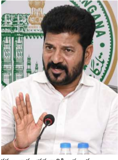
చర్యల భాగం ప్రస్తుతానికి అమలుకు వీలులేనిదిగా మారిపోయింది, ఇది బీఆర్ఎస్ అగ్రనేతలకు పెద్ద ఊరటనిచ్చింది.

కాశీశ్వరం ప్రాజెక్టుపై జస్టిస్ పీసీ ఘోష్ కమిషన్ సమర్పించిన నివేదిక ఆధారంగా మాజీ ముఖ్యమంత్రి కేసీఆర్, మాజీ మంత్రి హరీష్ రావులపై ప్రభుత్వం తక్షణమే ఎటువంటి కఠిన చర్యలు తీసుకోకుండా హైకోర్టు డ్రైట్ చేసింది. విచారణ చట్టం సెక్షన్ 8బి ప్రకారం, నివేదికలో ఎవరినైనా బాధ్యులుగా పేర్కొనే ముందు వారి వివరణ కోరడం తప్పనిసరి. అయితే, సరదు నిందితుల వాదన వినకుండానే ఘోషలుగా తీర్పును సహజ న్యాయసూత్రాలకు విరుద్ధమని ధర్మాసనం అభిప్రాయపడింది. ఈ సాంకేతిక లోపం కారణంగా నివేదికలోని