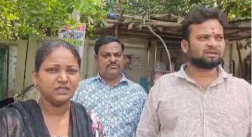
దిగుతూ, దళితులను కులం పేరుతో బూతు వదలతో దూషించడం వంటి ఘటనలు చోటుచేసుకున్నాయని బాధితులు వాపోతున్నారు.