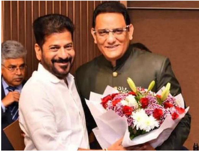
ముళ్లీ కేబినెట్ ద్వారా నిఫారను చేసేందుకు రెడ్డి గతంలో నిఫారను చేసినప్పుడు ప్రస్తుత గవర్నర్ లేరు. పాత గవర్నర్ ఉన్నప్పుడు కేబినెట్ చేసిన

గవర్నర్ తో భేటీ - రేవంత్ రెడ్డి వ్యూహం ఈ అంశంపై కొంతకాలంగా లోకేభవనకు, ప్రభుత్వానికి మధ్య ఉన్న ప్రతిఘటనను తొలగించేందుకు రేవంత్ రెడ్డి సయోధ్య మార్గాన్ని ఎంచుకున్నారు. గవర్నర్ తో జరిగిన భేటీలో ప్రొఫెసర్ కోదండరాం తెలంగాణ ఉద్యమ ప్రస్థానాన్ని, అజారుద్దీన్ విషయంలో ఉన్న రాజ్యాంగపరమైన అత్యవసర పరిస్థితిని సీఎం వివరించినట్లు తెలుస్తోంది. గతంలో గవర్నర్ కోటా నామినేషన్లపై కోర్టు కేసులు, సాంకేతిక అడ్డంకులు ఉన్నాయని ఇప్పుడు సుప్రీంకోర్టు నుండి కూడా సానుకూల సంతకాలు ఉన్నాయని గవర్నర్ కు తెలియజేశారు. రాజకీయాలతో పుర్వం కంటే చర్చల ద్వారానే పనులు పూర్తి చేసుకోవాలనేది రేవంత్ మార్కెట్ వ్యూహంగా కనిపిస్తోంది.