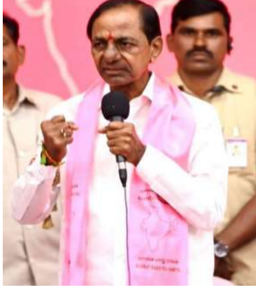
నిర్వహించిన కీలక భేటీలో ఆయన ఈ అంశంపై పూర్తి క్షారిటీ ఇచ్చారు.

హైదరాబాద్ (ప్రశ్న న్యూస్) మహిళా రిజర్వేషన్ పట్ల తమ సంపూర్ణ మద్దతును ప్రకటిస్తూనే, దాని మునుగులో దక్షిణాది రాష్ట్రాలకు అన్యాయం చేసే 'డిలివిటీషన్' ప్రక్రియపై మాజీ ముఖ్యమంత్రి కేసీఆర్ అప్పట్లోనే (2023) తీవ్రస్థాయిలో ధ్వజమెత్తారు. మహిళా సాధికారతకు తాము ఎప్పుడూ పెద్దపీట వేస్తున్నామని, 2011లోనే అసెంబ్లీలో దీనిపై తీర్మానం చేశామని గుర్తుచేసిన ఆయన.. డిలివిటీషన్ విషయంలో మాత్రం కేంద్రం అనుసరించబోయే పూర్తిగా పై గట్టి హెచ్చరికలు జారీ చేశారు. జనాభా ప్రాతిపదికన నియోజకవర్గాల పునర్విభజన చేపడితే, అభివృద్ధిలో దూసుకుపోతున్న దక్షిణాది రాష్ట్రాలకు అది శాపంగా మారుతుందని కేసీఆర్ ఆందోళన వ్యక్తం చేశారు. గతంలో కేటీఆర్, హరీష్ రావులతో