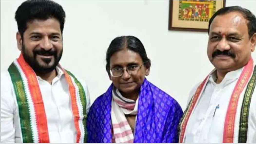
అసంతృప్తి స్వరాలపై ఆరా తీసిన మీనాక్షి పార్టీలో అక్కడక్కడా వినిపిస్తున్న అసంతృప్తి స్వరాలపై కూడా

ఈ భేటీలో అత్యంత ప్రాధాన్యత సంతరించుకున్న అంశం నామినేటెడ్ పదవుల భర్తీ. గత కొంతకాలంగా పార్టీ కోసం కష్టపడిన సీనియర్ నాయకులు, ద్వితీయ శ్రేణి కార్యకర్తలు పదవుల కోసం ఎదురుచూస్తున్నారు. మరో రెండు రోజుల్లోనే పెండింగ్లో ఉన్న కీలకమైన నామినేటెడ్ పోస్టులను భర్తీ చేయాలని ముఖ్యమంత్రి నిర్ణయించినట్లు తెలుస్తోంది. సామాజిక సమీకరణాలు, ప్రాంతీయ ప్రాతినిధ్యం దెబ్బతినకుండా జాబితాను సిద్ధం చేయాలని సీఎం పార్టీ నేతలకు సూచించారు. ఇది కార్యకర్తలలో కొత్త ఉత్సాహాన్ని నింపుతుందని అభిప్రాయం వ్యక్తమైంది.