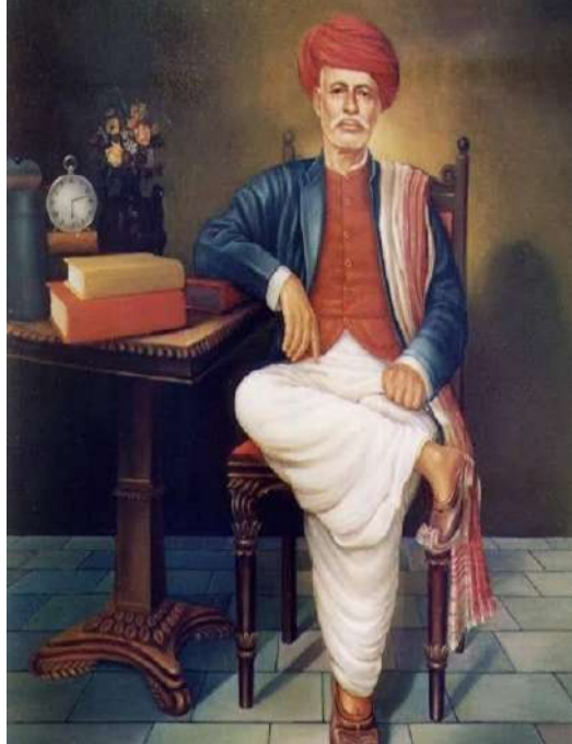
నిలిచి ఉన్నారు. 'మహాత్మా' అనే బిరుదు మన దేశంలో ఇద్దరికీ మాత్రమే ఉంది. ఒకటి మనకు స్వాతంత్ర్యాన్ని తేవటంలో కీలక భూమిక పోషించిన గాంధీకి. రెండోది మన సమాజానికి పునాదిరాళ్లుగా నిలిచిన నిమ్మ వర్షాల ఉన్నతి కోసం పాటుపడిన పూలేకి.

దేశమనే దేశానికి శూద్రులే ప్రాణం. వారే రక్షణకాలు'- ఈ మాటలు అనేక సందర్భాల్లో నాకు గుర్తుకు వస్తూ ఉంటాయి. ఈ మాటలు ఆస్పది ఎవరో కాదు. మహాత్మా జ్యోతిబా పూలే. ప్రజాస్వామ్యం పరిణతి చెంది.. పరిధివిస్తూనే వర్తమాన సమాజంలో ఇలాంటి వ్యాఖ్యలను ఎవరూ పెద్దగా పట్టించుకోకపోవచ్చు. కుల వ్యవస్థ ప్రాతిపదిక సమాజ గమనం ఉన్న సమయంలో.. అంటరానితనం కొన్ని కోట్ల మంది జీవితాల్లో అతి సామాన్యమైన విషయంగా ఉన్నప్పుడు, ఒక వ్యక్తి అణగారిన జీవితాల గురించి ఈ తరహా వ్యాఖ్యలు చేయటం.. దానివల్ల ఎదురయిన కష్టనష్టాలను ఓర్చుకొని ముందుకు సాగటం అంత సులభం కాదు. అందుకే ఈనాటికీ మనకు జ్యోతిబా పూలే ఆరాధ్యదయ్యారు. కొన్ని కోట్ల మంది గుండెల్లో