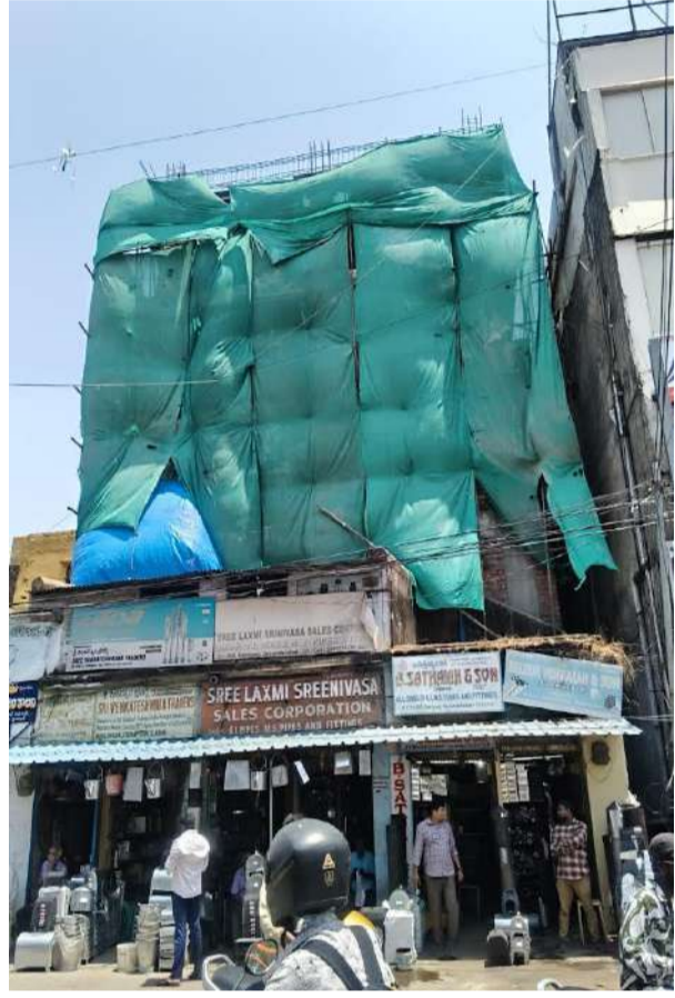
టౌన్ ప్లానింగ్ అధికారుల మౌనం వెనుక మాయ ఏమిటి?

కవాడిగూడ సర్కిల్ పరిధిలో మున్సిపల్ నిబంధనలు ఉల్లంఘిస్తూ నిర్మాణం జరుగుతున్నప్పటికీ టౌన్ ప్లానింగ్ అధికారులు ఒక్క నోటీసు కూడా ఇవ్వకపోవడం అనుమానాలకు తావిస్తోంది. సాధారణంగా చిన్న చిన్న తప్పిదాలకే నోటీసులు జారీ చేసే అధికారులు, ఇంత పెద్ద నిర్మాణాన్ని పట్టించుకోకపోవడం వెనుక 'లంచాల మాయ' ఉందనే ఆరోపణలు వినిపిస్తున్నాయి. టౌన్ ప్లానింగ్ అధికారులు లంచాలకు ఇస్తున్న ప్రాధాన్యత చట్టాలకు ఇవ్వడం లేదని విమర్శలు వినిపిస్తున్నాయి ఉన్నత అధికారులు కూడా మన వహించడం వెనుక వాళ్ల హస్తం ఉందన్న విమర్శలు ఉన్నాయి.