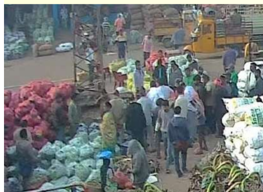
కంటోన్మెంట్ (ప్రశ్న న్యూస్) డాక్టర్ బి ఆర్ అంబేద్కర్ కూరగాయల మార్కెట్ లో కమిషన్ ఏజెంట్ల పాకడలకు అడ్డు అడుపు లేకుండా పోయింది. చివరకు ప్రభుత్వ ఆస్తిని సైతం కట్టాకాల్చి వేయడం పరిపాటిగా మారినది మేధావులు

(నాన్ బెయిలబుల్ ఎఫ్సీస్) సెక్షన్:427 కింద కేసు నమోదు చేయొచ్చు.