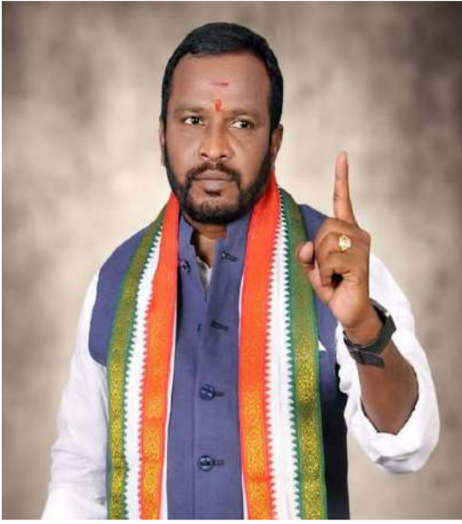
అధికారులపై కూడా కేసులు పెట్టాలి:

టౌన్ ప్లానింగ్ అధికారుల అవినీతి, నిర్లక్ష్యంతో కార్మికుల ప్రాణాలు పోతుంటే ఉన్నత అధికారులు స్పందించరా అని ప్రశ్నించారు. జిహెచ్ఎస్ కమిషనర్ కు జోనల్ కమిషనర్ కు మున్సిపల్ చట్టాల రక్షణ పై చిత్తశుద్ధి ఉంటే వెంటనే చర్యలు తీసుకోవాలని అక్రమ నిర్మాణాన్ని సీజ్ చేయాలి బిల్డింగ్ను అరెస్ట్ చేయాలి నిర్మాణ అనుమతులపై విజిటిస్ విచారణ చేపించి కార్మిక కుటుంబానికి 50 లక్షలు నష్ట పరిహారం అందించాలన్నారు.