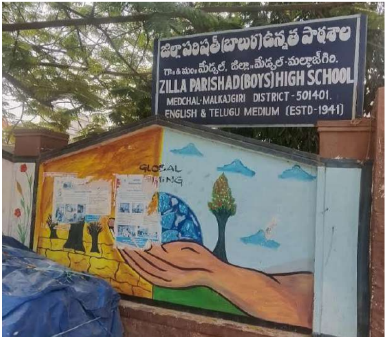
సమయంలో ఇటువంటి భారీ పరికరాల ఏర్పాటు పల్ల విద్యార్థులకు అనుకొని ప్రమాదాలు జరిగే అవకాశం ఉంది.