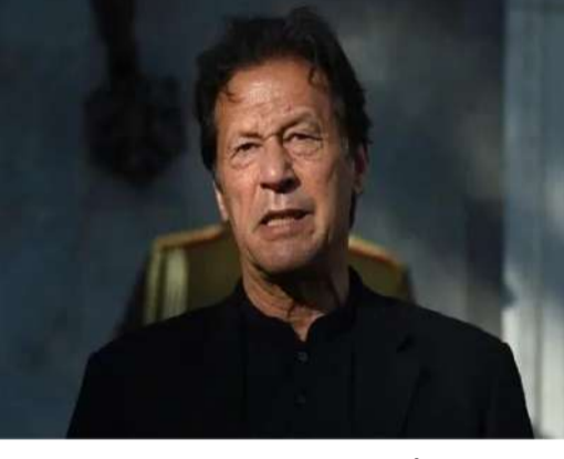
ప్రస్తుతం ఇమ్రాన్ ను మెరుగైన చికిత్స కోసం ఆసుపత్రికి తరలించే అవకాశాలు కనిపిస్తున్నాయి.

15 శాతం దృష్టి మాత్రమే మిగిలి ఉందని తెలియడంతో ఆయన అభిమానులు, క్రికెట్ కు దిగ్బలంగా గుర్తించింది. 2023 సెప్టెంబర్ నుంచి ఇమ్రాన్ ఖాన్ జైలులో ఏకాంత నిర్బంధంలో ఉన్నారు. గత ఏడాది అక్టోబర్ నుంచే కంటి సమస్యలతో బాధపడుతున్నా, జైలు అధికారులు నిర్ణయం చేశారని ఆయన కుటుంబ సభ్యులు, న్యాయవాదులు ఆరోపిస్తున్నారు. ఈ విషయం పాకిస్తాన్ సుప్రీం కోర్టు దృష్టికి వెళ్లడంతో, కోర్టు ఆదేశాల మేరకు వైద్య పరీక్షలు నిర్వహించారు. ఈ వార్త తెలియగానే పాక్ క్రికెటర్లు స్పందించారు. "రాజకీయాలను పక్కన పెట్టి చూస్తే.. ఆయన మా జాతీయ హీరో. 1992 ప్రపంచ కప్ గెలిపించారు. క్యాన్సర్ హాస్పిటల్ కట్టించారు. అలాంటి వ్యక్తికి సరైన చికిత్స అందించాలి" అని వకార్ యూనిస్ భావోద్వేగానికి కోరారు. షాహిద్ అఫ్రిది, రమీజ్ రాజా వంటి అనేక మంది మాజీ ఆటగాళ్లు కూడా మానవతా దృక్పథంతో స్పందించి, మెరుగైన వైద్యం అందించాలని విజ్ఞప్తి చేశారు.