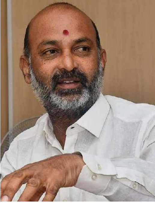
జరిగే ఈ సూతన పథకం కావాలా వద్దా అంటూ బండి సంజయ్ ప్రజలను ప్రశ్నించారు. వి బి జి రామ్ జీ పథకం పైన రాజకీయాలు చేయడం కాంగ్రెస్ నీవ రాజకీయాలకు నిదర్శనమని విమర్శించారు. గ్రామీణ పేదలకు ఉపాధి, రైతులకు మేలు చేసే ఈ పథకాన్ని అడ్డుకోవడం సరికాదని స్పష్టం చేశారు.

ఎయిర్ పోర్ట్ కు ఎన్టీఆర్ పేరును తొలగించి రాజీవ్ గాంధీ పేరు పెట్టలేదా అంటూ నిలదీశారు. మీరు చేస్తే సంసారం మేము చేస్తే వ్యధిచారమా అంటూ ఆగ్రహం వ్యక్తం చేశారు. ప్రజలకు మంచి