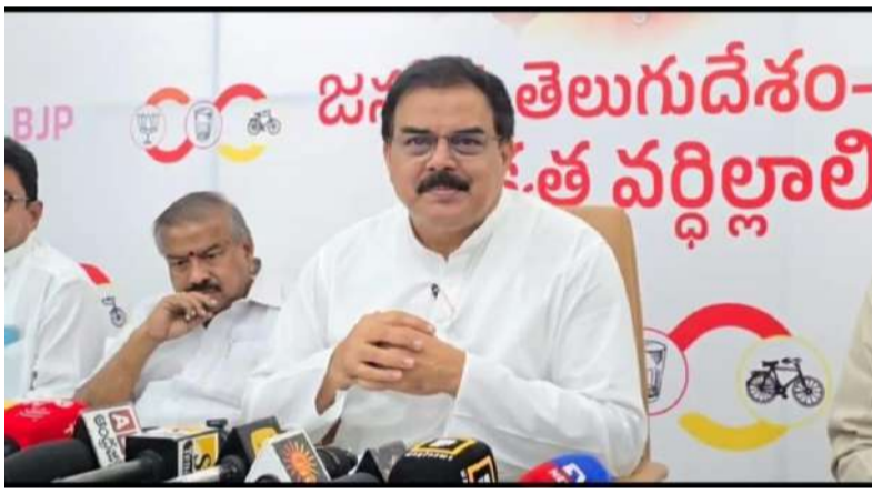
గత జగన్మోహన్ రెడ్డి ప్రభుత్వానిదే అని పేర్కొన్నారు. ఈ పరిస్థితులకు పూర్తిగా భిన్నంగా, కూటమి ప్రభుత్వం అధికారంలోకి వచ్చిన వెంటనే ధాన్యం కొనుగోలు వ్యవస్థను బలోపేతం చేసిందన్నారు. రైతుకు నచ్చిన మిల్లులోనే ధాన్యం విక్రయించే స్వేచ్ఛావిక్రయించిన 24--48 గంటల్లోనే నగదు నేరుగా రైతు ఖాతాల్లో జమతేమ శాతం సమస్యలు తొలగించేందుకు రైతు సహాయ కేంద్రాలు, మిల్లుల్లో ఒకే రకమైన యంత్రాల ఏర్పాటుపటికీ తీలక సంస్కరణలు అమలు చేశామని తెలిపారు.

తెనాలి (ప్రశ్న స్వాస్) ఖరీఫ్ సీజన్లో కేంద్ర ప్రభుత్వం నిర్దేశించిన 50 లక్షల మెట్రిక్ టన్నుల అమ్మకానికి గాను, రాష్ట్రంలో ఇప్పటివరకు 6,76,848 మంది రైతుల నుంచి 41.27 లక్షల మెట్రిక్ టన్నుల ధాన్యం కొనుగోలు చేసినట్లు రాష్ట్ర ఆహార, పౌరసరఫరాలు & వినియోగదారుల వ్యవహారాల శాఖ మంత్రి నాదెండ్ల మనోహర్ తెలిపారు. ఇప్పటికే రూ.9,789 కోట్లను రైతుల ఖాతాల్లో నేరుగా జమ చేయగా, సంక్రాంతి పండుగ నాటికి రాష్ట్ర చరిత్రలో తొలిసారిగా రూ.10,000 కోట్లకు పైగా ధాన్యం కొనుగోలు చెల్లింపులు పూర్తవుతాయని మంత్రి పేర్కొన్నారు. తెనాలి మంత్రి క్యాంపు కార్యాలయంలో నిర్వహించిన మీడియా సమావేశంలో మంత్రి మాట్లాడుతూ, రాష్ట్ర సంక్షేమమే పరమావధిగా ముఖ్యమంత్రి నారా చంద్రబాబు నాయుడు, ఉపముఖ్యమంత్రి పవన్ కళ్యాణ్ మార్గదర్శకత్వంలో కూటమి ప్రభుత్వం ధాన్యం కొనుగోలు ప్రక్రియను అత్యున్నత పారదర్శకంగా, వేగంగా, సమర్థవంతంగా నిర్వహించి రాష్ట్ర చరిత్రలోనే ఒక కొత్త మైలురాయిని సాధించిందని తెలిపారు. గత ప్రభుత్వ హయాంలో కష్టపడి పండించిన ధాన్యానికి సేలవ తరబడి డబ్బులు రాక రైతులు దళారులపై ఆధారపడాల్సిన పరిస్థితి ఏర్పడిందని విమర్శించారు. రైతులకు చెల్లించాల్సిన రూ. 1,674 కోట్ల బకాయిలను పెండింగ్లో ఉంచిన ఘనత