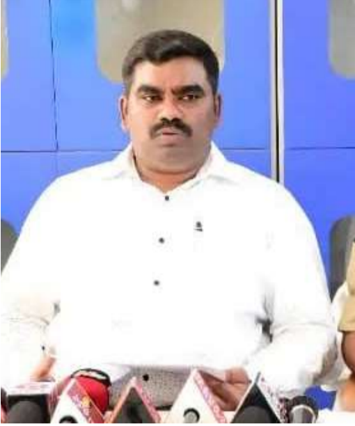
క్రమశిక్షణ చర్యలు తప్పవని కమిషనర్ హెచ్చరించారు.

అర్హతైన ఉద్యోగులు, అధికారులకు వెంటనే పదోన్నతులు ఇచ్చేందుకు చర్యలు తీసుకోవాలని పేర్కొన్నారు. సహేతుక కారణాలు లేకుండా పదోన్నతుల నిర్వహణలో జాప్యం చేస్తే మాత్రం