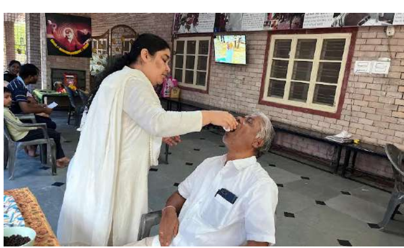
మేద్చల్ (ప్రశ్న న్యూస్) మృగశిర కార్తి సందర్భంగా కండ్లకోయలోని సాయి గీత ఆశ్రమం లో నిర్వహించిన ఉచిత ఆస్త్రమా వైద్య శిబిరానికి విశేష స్పందన లభించింది. ఈ శిబిరంలో వేయి