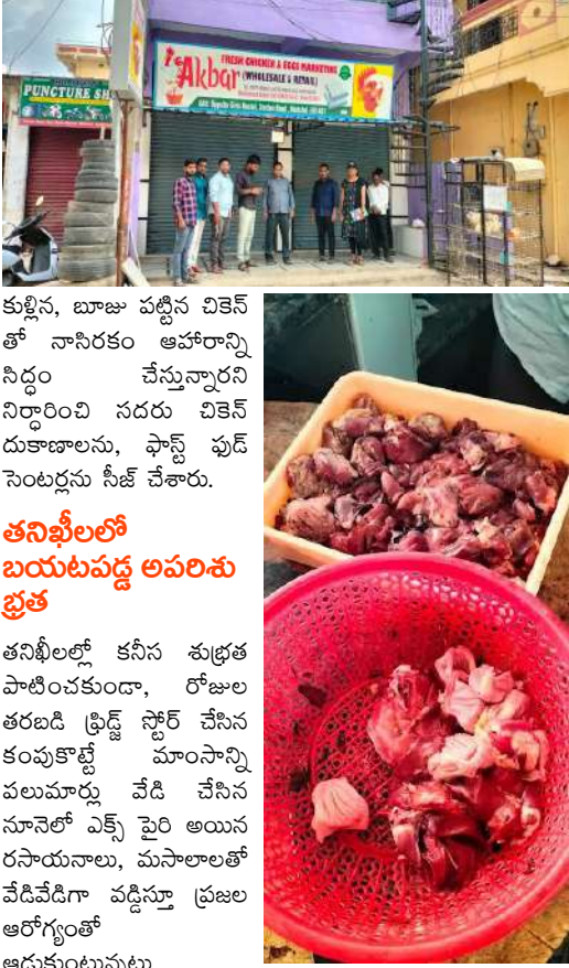
తనిఖీలలో బయటపడ్డ అవరిశు భుత