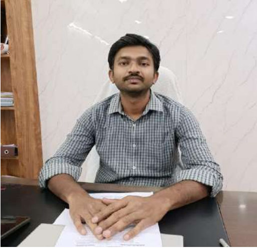
కత్తి ఫుడ్ తో ప్రమాదం..