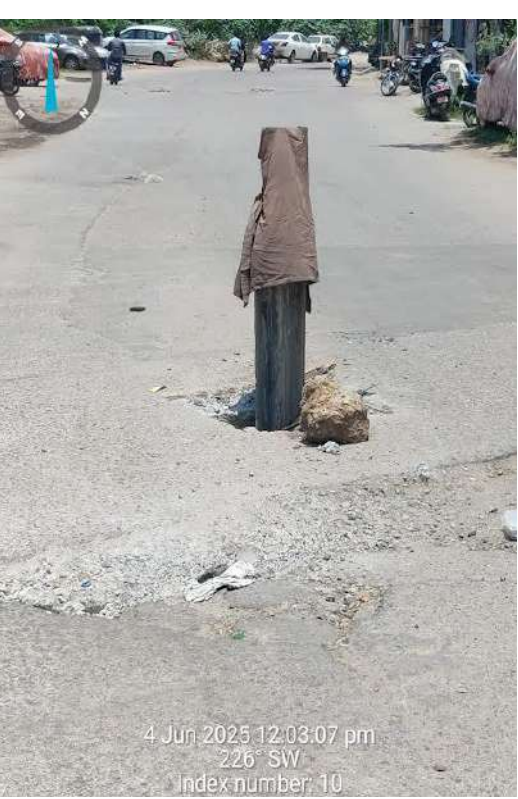
ప్రమాదాలన బారిన పడతారో అని భయంతో వసతి పోతున్నారు.