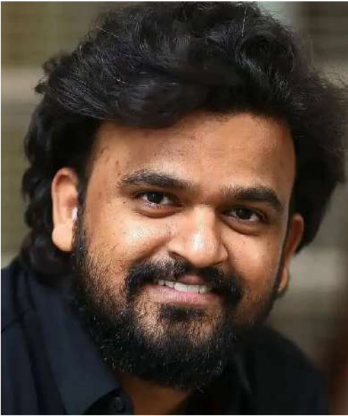
లేదా రివ్యూలలో నెగటివిటీ వస్తే అంత సులభంగా అంగీకరించని ఈ ఎంటిబిఎస్ డైరెక్టర్ కు హిట్ 3 యునానిమస్ గా అందరినీ మెప్పించలేదనే వాస్తవం అర్థమైపోయింది.