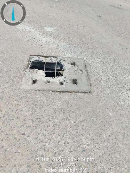
రేపంత్ రెడ్డి అధికారులకు పడేపడే ప్రజా సమస్యల పై స్పందించాలని తెలిపిన అధికారులకు ప్రజా సమస్యలను తీర్చడంలో పూర్తిగా విఫలం చెందుతున్నారు. ప్రజల సమస్యలను తీర్చడంలో అధికారులు నిబ్బంది ఎందుకు ఇంత నిర్లక్ష్యం చేస్తున్నారని ప్రజలు ప్రశ్నిస్తున్నారు. ఉప్పల్ సర్కిల్ పరిధిలో ప్రజల సమస్యలను తీర్చడంలో ప్రజా ప్రతినిధులు అధికారులు పూర్తిగా విఫలం చెందుతున్నారు. ఎక్కడి సమస్యలు అక్కడే ఉండిపోవడంతో ప్రజలు ఈ సమయంలో ఏ సంఘటనలతో

నుండి నాగోల్ మెట్రో స్టేషన్ కు వెళ్లే దారిలో ఎక్కడ చూసినా డ్రైనేజీ మూతలు పగిలిపోయి ప్రమాదకరంగా ఉన్నాయని అధికారులకు స్థానిక ప్రజాప్రతినిధులకు ప్రజా సమస్యలు కనబడలేవా అని ప్రజలు ప్రశ్నిస్తున్నారు. ఈ మార్గం గుండా రోజూ అనేక వాహనాలు వెళ్తాయని జరగరాని సంఘటన జరిగితే దానికి బాధ్యులు మున్సిపల్ అధికారుల లేక ప్రజాప్రతినిధులలా అని ప్రజల ప్రశ్నిస్తున్నారు. ఈ ప్రాంతంలో వర్షం వడితే రోడ్లపై వర్షం నీరు నిలుస్తుందని, అధికారులు వర్షం నీళ్లు ఒకేచోట నిలవకుండా ఉండే ప్రయత్నం చేయాలని రానున్న పక్కాకాలంలో ప్రజలకు ఇబ్బంది లేకుండా అధికారులు చూడాలని, ఈ ప్రాంతంలో డ్రైనేజీ మూతలు పగిలిపోయి ఉండడంతో వాహనదారులు ఇబ్బంది పడుతున్నారని అధికారులు కాస్త తొందరగా స్పందించి అలీ కేఫ్ నుండి నాగోల్ కు వెళ్లే దారిలో రోడ్డు పై ఎలాంటి గుంతలు లేకుండా డ్రైనేజీ మూతలను కొత్తవి ఏర్పాటు చేపట్టాలని అధికారులు కార్యాలయాల్లోనే ఒకే చోట కూర్చోకుండా ప్రజా సమస్యల పై స్పందించాలని ముఖ్యమంత్రి