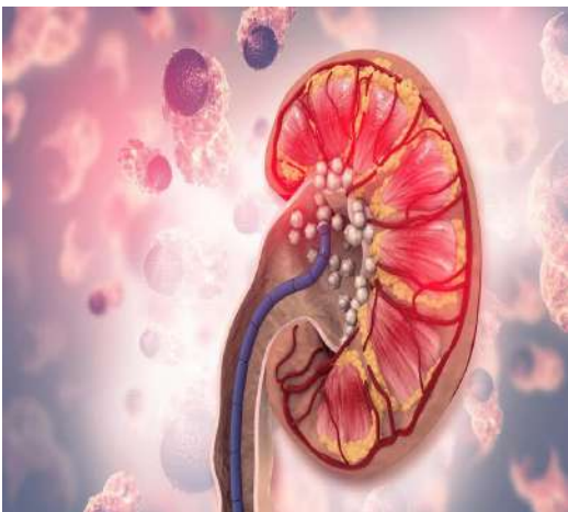
యాసిడ్ రాళ్ళు వచ్చే ప్రమాదం ఎక్కువగా ఉంటుంది.