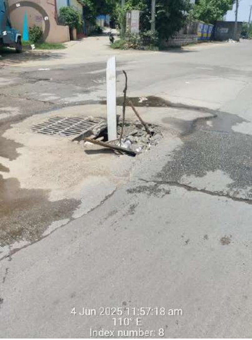
హైదరాబాద్ (ప్రశ్న స్కూప్) గ్రేటర్ హైదరాబాద్ మున్సిపల్ పరిషత్ సమస్యలు తీవ్ర వేళాయి. సమస్యలు పరిష్కరించవలసిన ప్రజా ప్రతినిధులు అధికారులు తమ సొంత అభివృద్ధికి పాటపడుతూ ప్రజల సమస్యలను గాలికి వదిలేసారు.అలీ కేఫ్