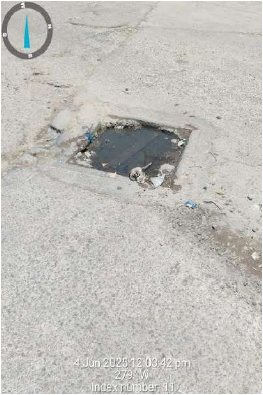
ప్రమాదాలన బారిన పడతారో అని భయంతో వసతి పోతున్నారు.

నుండి నాగోల్ మెట్రో స్టేషన్ కు వెళ్లే దారిలో ఎక్కడ చూసినా డ్రైనేజీ మూతలు పగిలిపోయి ప్రమాదకరంగా ఉన్నాయని అధికారులకు స్థానిక ప్రజాప్రతినిధులకు ప్రజా సమస్యలు కనబడలేవా అని ప్రజలు ప్రశ్నిస్తున్నారు. ఈ మార్గం గుండా రోజూ అనేక వాహనాలు వెళ్తాయని జరగరాని సంఘటన జరిగితే దానికి బాధ్యులు మున్సిపల్ అధికారుల లేక ప్రజాప్రతినిధులలా అని ప్రజల ప్రశ్నిస్తున్నారు. ఈ ప్రాంతంలో వర్షం వడితే రోడ్లపై వర్షం నీరు నిలుస్తుందని, అధికారులు వర్షం నీళ్లు ఒకేచోట నిలవకుండా ఉండే ప్రయత్నం చేయాలని రానున్న పక్కాకాలంలో ప్రజలకు ఇబ్బంది లేకుండా అధికారులు చూడాలని, ఈ ప్రాంతంలో డ్రైనేజీ మూతలు పగిలిపోయి ఉండడంతో వాహనదారులు ఇబ్బంది పడుతున్నారని అధికారులు కాస్త తొందరగా స్పందించి అలీ కేఫ్ నుండి నాగోల్ కు వెళ్లే దారిలో రోడ్డు పై ఎలాంటి గుంతలు లేకుండా డ్రైనేజీ మూతలను కొత్తవి ఏర్పాటు చేపట్టాలని అధికారులు కార్యాలయాల్లోనే ఒకే చోట కూర్చోకుండా ప్రజా సమస్యల పై స్పందించాలని ముఖ్యమంత్రి