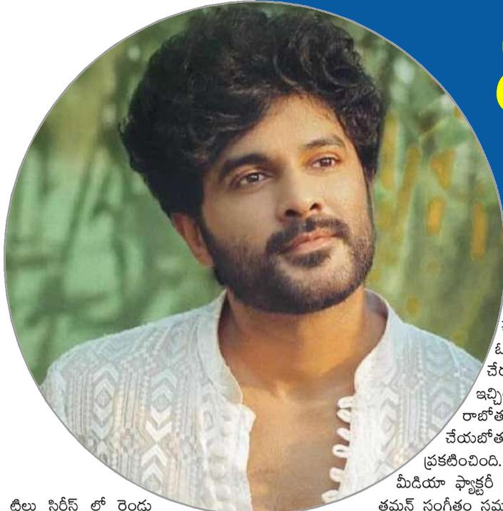
టిల్లు సిరీస్ లో రెండు సినిమాలు భాక్ బస్టరయ్యాక సిద్ధు జొన్నలగడ్డకు జాక్ ఇచ్చిన షాక్ మామలుది కాదు. కనీసం యావరజే అయిన ఏడోలే