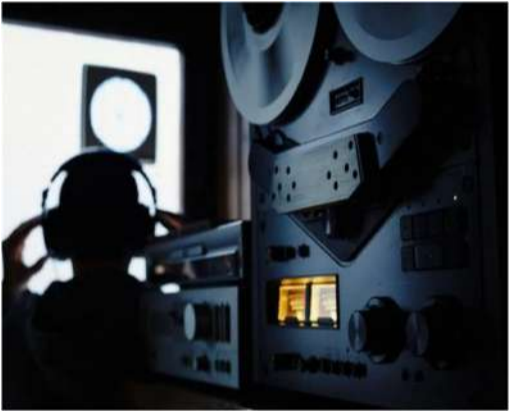
కారణంగా పొందడం కష్టం.

దర్బాపుతో న్యాయం చేస్తామని ప్రభుత్వం హామీ ఇచ్చింది. అయితే, కేసీఆర్ ప్రత్యక్ష పాత్రను నిరూపించడం సవాళ్లతో కూడుకున్నది. నిఘా కార్యకలాపాలను కేసీఆర్ లేదా సీనియర్ బీఆర్ఎస్ నాయకులతో నృష్టంగా అనుసంధానించే ఆధారాల గోలునును దర్బాపు బృందం స్థాపించాలి. అధికారిక అదేశాలు, సమాచారాలు లేదా కీలక ఆపరేటివ్ల నుంచి ఒప్పుకోలు వంటి ఆధారాలు అవసరం, ఇవి ఈ కార్యకలాపాల నున్నత స్వభావం