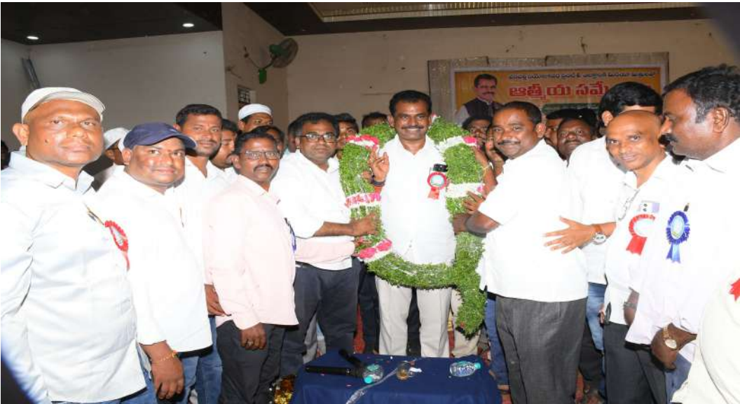
వనపర్తి నియోజకవర్గ పరిధిలోని ప్రతి జర్నలిస్టుకు తానే స్వయంగా బీమా చేయిస్తానని అందుకు సంబంధించిన చర్యలు