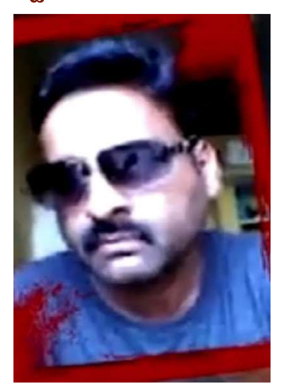
అసభ్యంగా ప్రవర్తిస్తే వారిపై చట్టపరమైన చర్యలు తీసుకోవచ్చు.

్రైవేట్ ట్యూషన్ టీచర్లపైనా: (పైవేట్ ట్యూషన్ టీచర్లు కూడా ఈ చట్టాల పరిధిలోకి వస్తారు, వారు కూడా విద్యార్థులతో