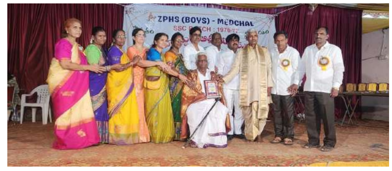
మేద్చల్ (ప్రశ్న న్యూస్) మేద్చల్ మండలం గౌదవెల్లి గ్రామంలోని రామ్ రెడ్డి ఫంక్షన్ హాల్ లో మేద్చల్ జిల్లా పరిషత్ హై స్కూల్1977 బ్యాచ్ 10వ తరగతి పూర్వ విద్యార్థులు 48 సంవత్సరాల