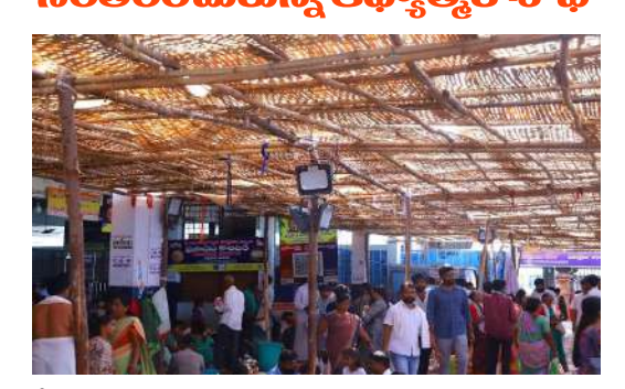
(ట్రత్న న్యూస్) నేదు ఆదివారం "(శీరామ నవమి" వేదుకలను అత్యంత వైభవోపేతంగా నిర్వహించనున్న నేపథ్యంలో