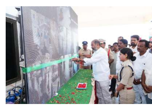
మోదల్ పోలీస్ స్టేషన్: భద్రతా వ్యవస్థను మరింత పటిష్టం చేయాలని సభలో ప్రస్తావించారు.

రుదంగి పోలీస్ స్టేషన్: రూ. 2.50 కోట్లు మంజూరి. మహిళా, ట్రాఫిక్ పోలీస్ స్టేషన్లు: వేములవాడలో అవసరమని