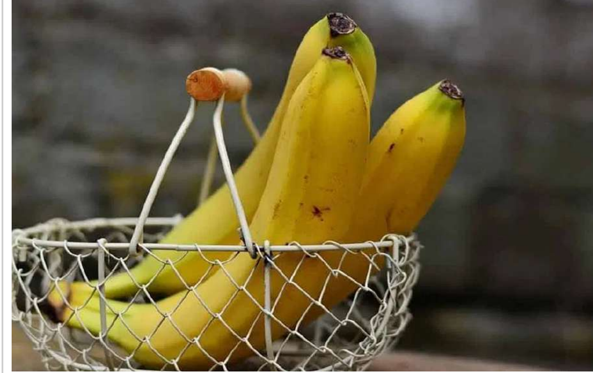
ఉబ్బరం, నొప్పి వస్తుంది. ఈ కారణాలన్నింటి దృష్ట్యా ఉదయం వేళ ఆరోగ్యకరమైన ఆహారం తినడం చాలా ముఖ్యం. కాబట్టి ఇటీ, డోస్, పొంగల్ వంటి తేలిక పానీ ఆహారాలు తినడం ఆరోగ్యానికి మంచిది.

తీసుకోవడం మంచిది. సాధారణంగా, ఖాళీ కడుపుతో ట్యూబెట్స్ తీసుకోకూడదు. ఇవి కడుపులోని ఆమ్లంతో కలిసిపోయి కడుపు పొరను దెబ్బతీస్తాయి. దీనివల్ల అల్సర్లు, రక్తస్రావం వంటి సమస్యలు వస్తాయి. డాక్టర్ సూచించినట్లయితే కొన్ని ప్రత్యేక ట్యూబెట్స్ మాత్రమే ఖాళీ కడుపుతో తీసుకోవాలి. కానీ సాధారణంగా ఆహారం తిన్న తర్వాతే ట్యూబెట్స్ తీసుకోవడం మంచిది. ఖాళీ కడుపుతో అరటిపండ్లు తినకూడదు అరటిపండ్లలో మెగ్నీషియం అధికంగా ఉంటుంది. ఉదయం ఖాళీ కడుపుతో అరటిపండ్లు తింటే, రక్తంలో మెగ్నీషియం స్థాయి అకస్మాత్తుగా పెరుగుతుంది. దీని వల్ల గుండె దెబ్బతింటుంది. ఉదయం కాకుండా మధ్యాహ్నం భోజనం తర్వాత లేదా సాయంత్రం వేళ అరటిపండ్లు తినడం మంచిది. ఖాళీ కడుపుతో టమోటాలు తినడం మంచిది కాదు టమోటాలను ఖాళీ కడుపుతో తినకూడదు. వాటిలో టానిక్ ఆమ్లం ఉంటుంది. ఇది కడుపులో ప్రవించే ఆమ్లంతో కలిసిపోయి సస్టాన్ని కలిగిస్తుంది. కాబట్టి, పంటల్లో వీటిని ఇతర ఆహారాలతో కలిపి తీసుకోవడం మంచిది. ఖాళీ కడుపుతో కారంగా ఉండే ఆహారం తినడం ఖాళీ కడుపుతో కారంగా ఉండే ఆహారాలు తినడం వల్ల కడుపులో మంట, అల్సర్లు వస్తాయి. కారంగా ఉండే ఆహారాలలో ఉండే క్యాల్షియం కడుపు పొరను చికాకుపెడుతుంది. దీనివల్ల కడుపులో నొప్పి, మంట వస్తుంది. శీతల పానీయాలు తాగద్దు ఖాళీ కడుపుతో కాలే డ్రింక్స్ తాగడం వల్ల కడుపులో గ్యాస్ సమస్యలు వస్తాయి. సాఫ్ట్ డ్రింక్స్ లో కార్బన్ డయాక్సైడ్ ఎక్కువగా ఉంటుంది. దీనివల్ల కడుపులో గ్యాస్ ఉత్పత్తి పెరుగుతుంది. దీనివల్ల కడుపులో