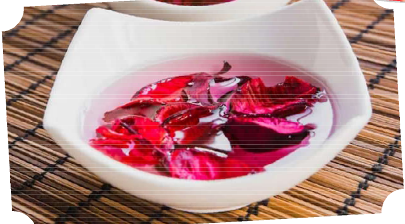
బలహీనపడుతుంది. మీరు కూడా మీ రోగనిరోధక శక్తిని బలోపేతం

ఈ యాంటీఆక్సిడెంట్లు సంభావ్య లిపిడ్ పెరాక్సిడేషన్ నిరోధక ప్రభావాలను కలిగి ఉంటాయని పరిశోధకులు చెబుతున్నారు. ఇవి మనల్ని ఆరోగ్యంగా ఉంచుతాయి. గులాబీ రేకులు, గులాబీ నూనెలో శక్తివంతమైన యాంటీఆక్సిడెంట్లు పుష్కలంగా ఉంటాయి. ఇవి కణాలు దెబ్బతినకుండా కాపాడతాయి. ఈ యాంటీఆక్సిడెంట్లు సంభావ్య లిపిడ్