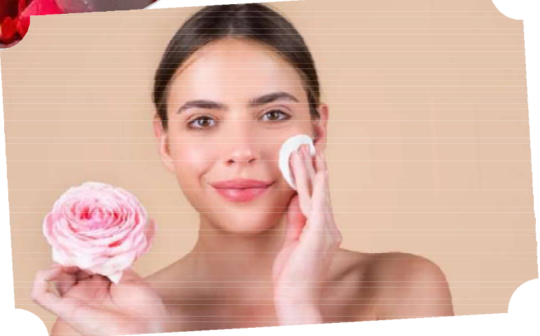
రక్షిస్తాయి. అలాగే ఇన్ఫెక్షన్ తొందరగా తగ్గిస్తాయి. అందుకే రోజ్ వాటర్ ను తరచుగా వివిధ సహజ, ఔషధ చికిత్సలలో