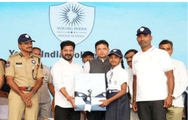
ఎంతో మంది ప్రధానులు, ముఖ్యమంత్రులు అయ్యారు కానీ అందులో కొద్ది మంది మాత్రమే చరిత్రలో గుర్తుండిపోయారని వెల్లడించారు. ఆ కొద్దిమంది తీసుకున్న నిర్ణయాలు చరిత్రను

హైదరాబాద్ (ప్రశ్న స్కూస్) “యంగ్ ఇండియా అనేది తన బ్రాండ్ అని సీఎం రేవంత్ రెడ్డి స్పష్టం చేశారు. ఎస్సీఆర్ కు రెండు రూపాయలకు కిలో బియ్యం, వై.యస్. రాజశేఖర్ రెడ్డికి జలయజ్ఞం ఎలాగైతే బ్రాండ్ గా మారిందో యంగ్ ఇండియాను తన బ్రాండ్ గా మార్చుకుంటా” అని సీఎం రేవంత్ రెడ్డి అన్నారు. ఎస్సీఆర్ మేనిఫెస్టోలోనే పోలీస్ స్కూల్ అంశాన్ని పొందుపరిచామని చెప్పిన రేవంత్ రెడ్డి ఆనాడు పండిట్ జవహర్ నెహ్రూ గారి సారథ్యంలో దేశంలో యూనివర్సిటీల పునాదులు పడాయని గుర్తుచేశారు. నెహ్రూ దార్శనికతతోనే మన దేశం ప్రపంచ దేశాలతో పోటీ పడే స్థాయికి చేరిందని కొనియాడారు. దేశ చరిత్రలో