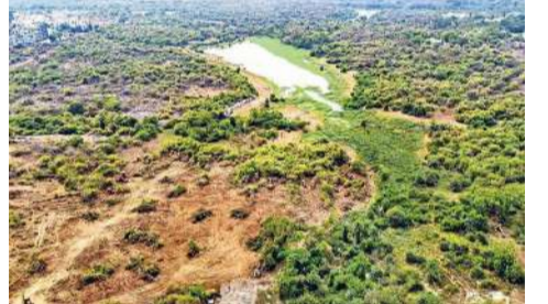
అక్కడి వారితో కూడా మాట్లాడబోతున్నారు. ప్రభుత్వ అధికారులతో కూడా సమావేశంకానున్నట్లు తెలుస్తోంది. కంచగచ్చిబొలిలోని

హైదరాబాద్ (ప్రశ్న స్కూస్) తెలంగాణలో పొలిటికల్ హిట్ పెంచిన కంచ గచ్చిబొలిలోని 400 ఎకరాల భూవివాదంలో కీలక అప్పడేట్ ఇది. సుప్రీంకోర్టు ఆదేశాల మేరకు కేంద్రం జోక్యం చేసుకుంది. అసలేం జరుగుతుందో తెలుసుకునేందుకు కేంద్ర పర్యావరణం, అటవీ శాఖల సాధికార కమిటీ వచ్చింది. క్షేత్రస్థాయి పరిశీలన చేపట్టింది. వివరాలు నమోదు చేసుకున్న తర్వాత నివేదికను సుప్రీంకోర్టుకు సమర్పించనుంది. సెంట్రల్ ఎంపవర్ కమిటీ చైర్మన్ సిద్ధాంత దానితోపాటు మరో ఇద్దరు ఈ కమిటీలో ఉన్నారు. ఈ ఉదయం హైదరాబాద్ చేరుకున్న ఈ కమిటీ విచారణ చేస్తోంది. కంచ గచ్చిబొలి భూముల్లో తిరిగి పరిశీలించనున్నారు.