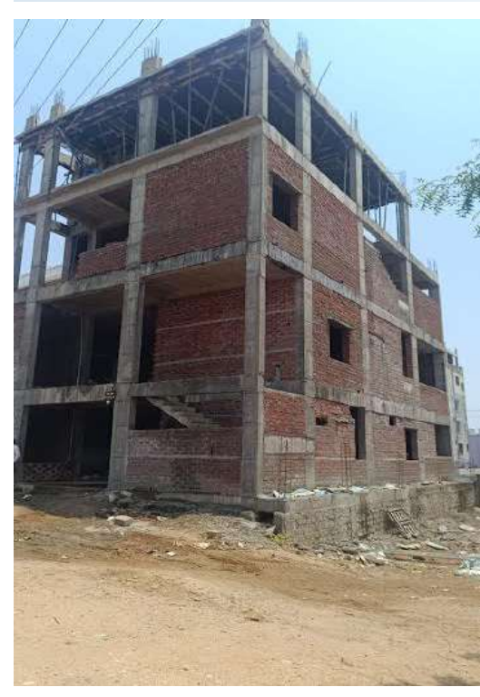
కాపా (ప్రశ్న న్యూస్) జిహెచ్ఎంసి పరిధిలో సిబ్బంది నుండి టౌన్