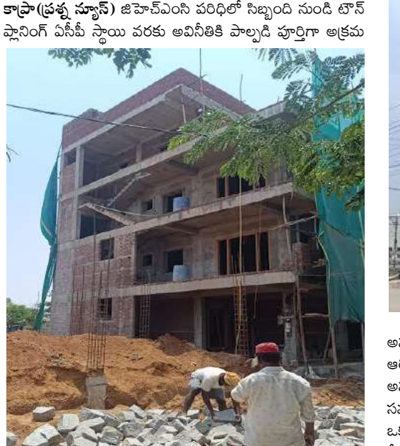
నిర్మాణాలకు సహకరిస్తున్నారని స్థానికులు ఆరోపిస్తున్నారు. ఇక్కడ అధికారులకు లక్షలలో వసూళ్లు జరుగుతున్నాయి అన్న ఆరోపణలు ఉన్నాయి. దీనిపై ఎల్బీనగర్ జోనల్ కమిషనర్ స్పందించకపోవడం పలు అనుమానాలకు తాడిస్తోంది.

కాప్రా సర్మిల్ పరిధిలోని పద్మశాలి టౌన్ షిప్ లో అక్రమ నిర్మాణాలు జోరుగా సాగుతున్న అధికారులు పట్టించుకోవటం లేదని విమర్శలు వెల్లివెత్తుతున్నాయి. ఇక్కడ చేపడుతున్న అక్రమ